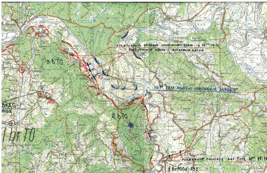
Karta 1. Razmještaj srpskih snaga na kupi uoči operacije „Vihor“