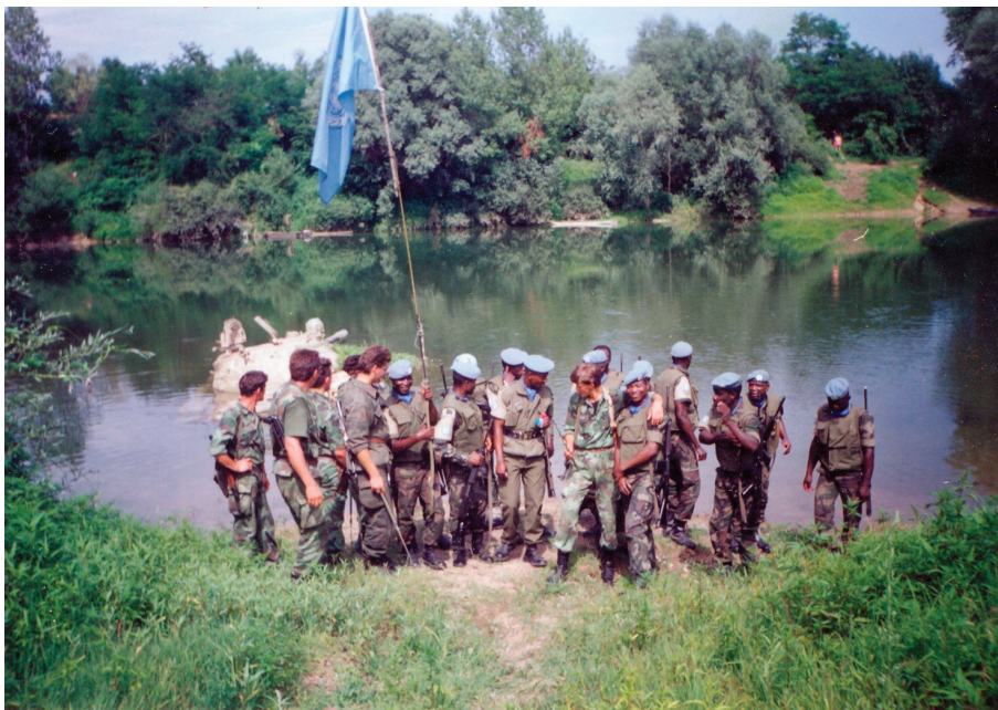
Slike 1-3. Srpski vojnici u nazočnosti pripadnika nigerijskog bataljuna UNPROFOR-a izvlače tenkove iz Kupe

opasnosti da se pokvari tenk za izvlačenje, kao i nemogućnosti da do njih priđe vučno vozilo. Prema izvješću iz rujna 1992., na tenkovima izvučenima iz Kupe koji su ušli u sastav tenkovske čete glinske brigade nedostajale su ciljne sprave, radiouređaji, puškomitraljezi kupole tenka (PKT) i protuavionski mitraljezi (PAM). 100 Ako uzmemo u obzir sve navedene podatke, ukupno je izgubljeno/zarobljeno najmanje devet tenkova i dva transportera HV-a, odnosno 10 tenkova ako se ovom broju pribroji i tenk zarobljen prvoga dana operacije.