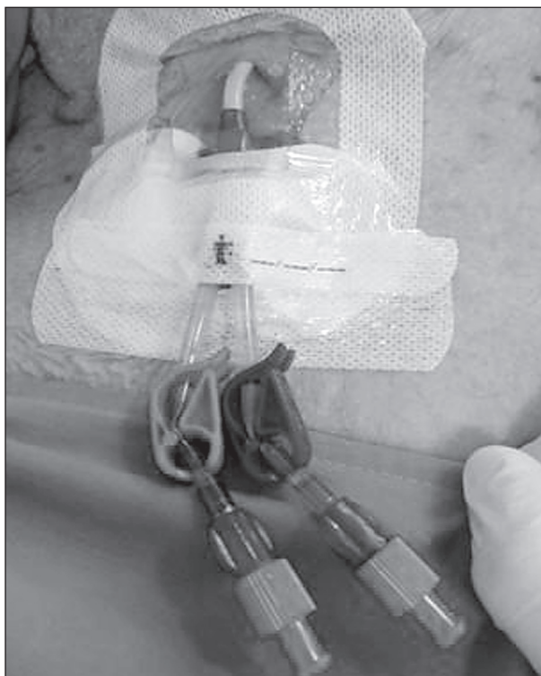
Sl. 2. Centralni venski kateter, sistem osiguranja položaja katetera primjenom Grip Lok®-a i primjenjenom prozirnom oblogom sa 2 % klorheksidin hidrogelnim jastučićem (TegadermTM) (Izvor: arhiva Zavoda za nefrologiju, dijalizu i transplantaciju bubrega) 17. prosinac 2017. Autor: Bosiljka Devčić, mag.med.techn.