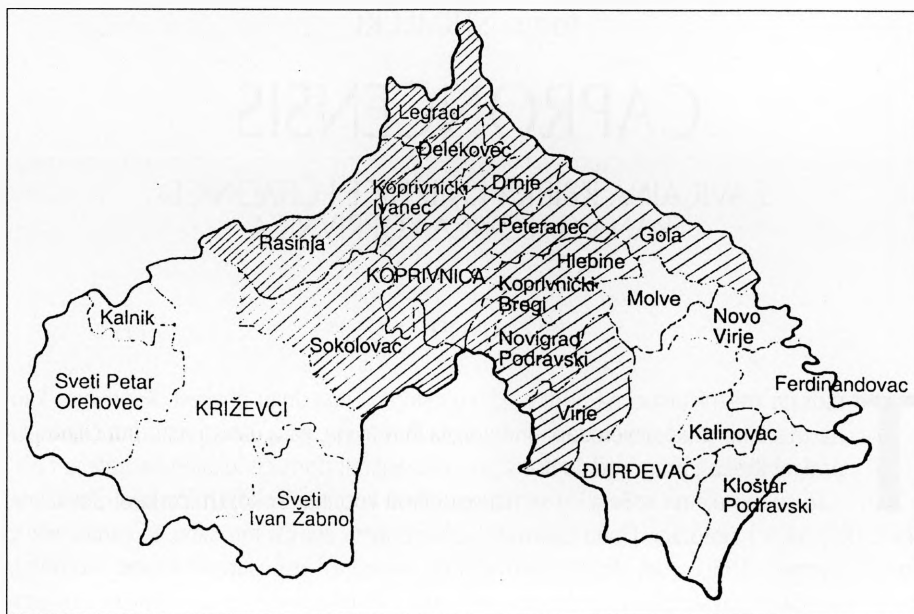
Karta 1. Područje zavičajne zbirke: grad Koprivnica i okolne općine

Na inicijativu nove vlasti, ali i pojedinaca, 3 krenulo se opet iz početka - skupilo se i popisalo knjiga, izabrao knjižničar (inače učitelj) i početkom studenog 1945. god. Knjižnica je otvorena. Bila je smještena u Domu kulture, današnji Domoljub 9. Međutim početni entuzijazam uskoro je naišao na probleme koji se kao konstanta ponavljaju - prostorni smještaj i neriješeno financiranje povezano s nedovoljnim interesom šire društvene zajednice. Tek 1953. god., kada Knjižnica postaje budžetska ustanova, stanje se mijenja. Te godine Knjižnica preseljava u nove prostorije (današnji Trg bana Jelačić 2) gdje će ostati sve do 1970. god.