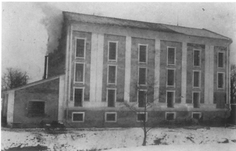
Parni mlin u Martijancu, početkom XX. stoljeća

kmetovi počeli napasati stoku na vlastelinskim poljima. Tražio je da županija poduzme energične mjere "pokle gospoštija ova radi silah i kvarov koje puk po sterni i livadama gospodskem od dneva do dneva zrokuje od kotarskoga sudca zadovolštinu i dudu dobiti ne može". Narodnjaci iz Upravnog odbora dobro su znali da su Egersdorfer i njegovi činovnici mađaroni, ali su ipak odredili da kotarski sudac podnesenu tužbu riješi u njihovu korist 12 .