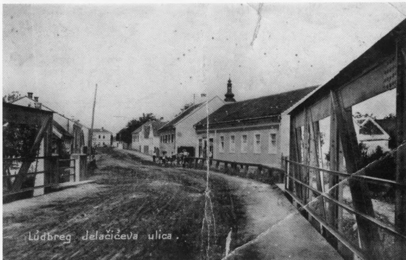
Most na Bednji u Ludbregu sagrađen 1910. godine

Velikobukovečki vlastelin grof Dragutin Drašković tužio je još 1. veljače 1848. svoje kmetove da nasilno provaljuju u njegovu šumu. Poslije izbijanja nemira, tj. revolucije, zapravo 20. svibnja 1848., ponovo se potužio "protiv seljakom iz Novog Sela i Županca porado silovitog nasertanja u šumu Križančiju". 7