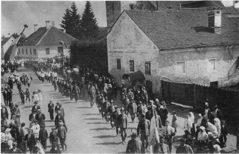
Ludbreg u prvoj četvrtini XX. stoljeća

Upravitelj ludbreškog vlastelinstva odbio je 21. svibnja 1848. izdati za naoružavanje naroda oružje koje se nalazilo u ludbreškom gradu. 30