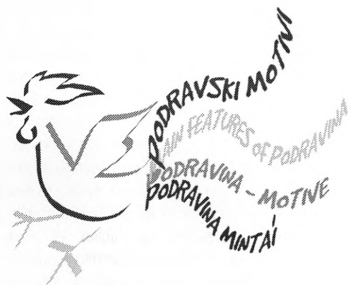
Znak i logotip priredbe "Podravski motivi" Autor Antonio Grgić