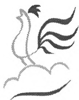
Turistički znak Koprivničko-križevačke županije Autor Antonio Grgić