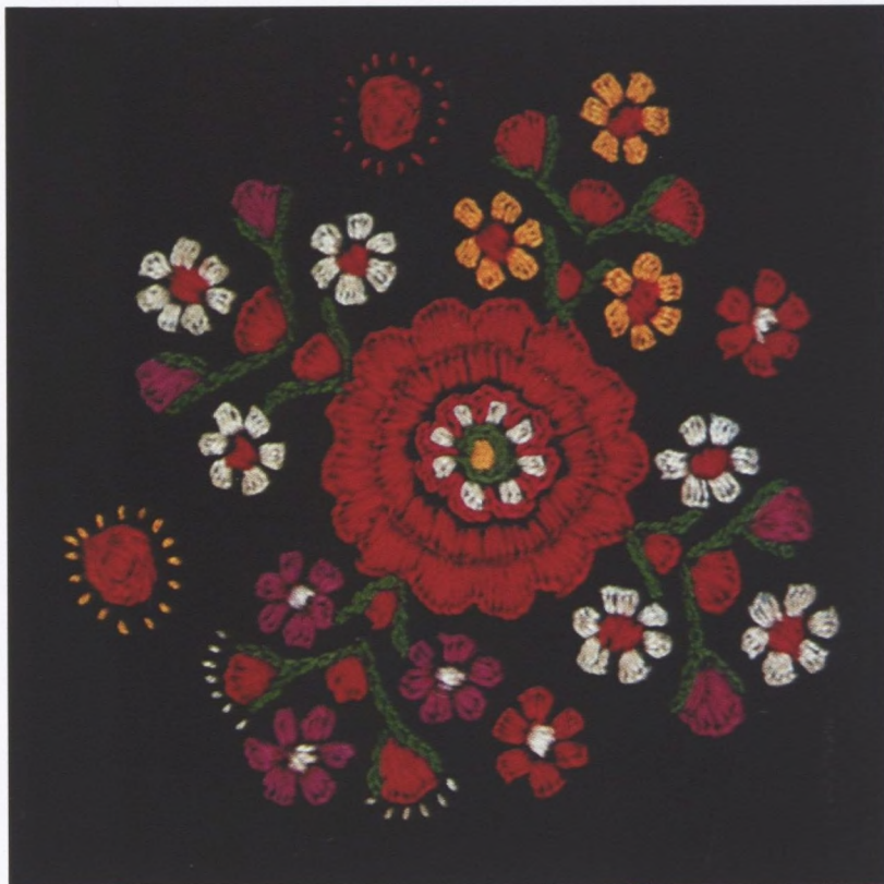
Sl. 3 – Detalj s marame (motiv: "pramaletske ruže")