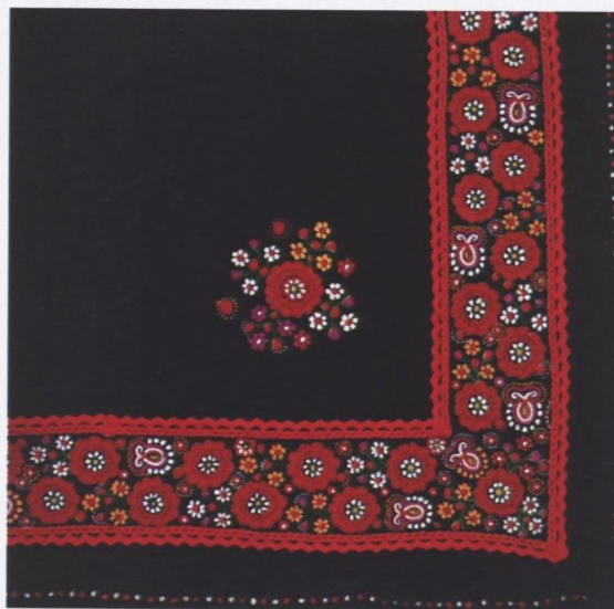
Sl. 2 - Marama, vez na crnoj "čoji" (motivi: "pramaletske ruže", "tulipani")