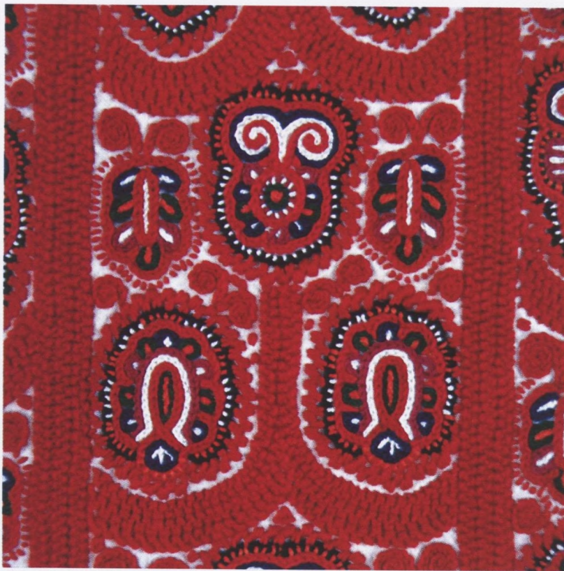
Sl. 1 - Vez s rukava (motivi: "vurice", "tulipani", "hrastov list", "racine steze", "frkice")