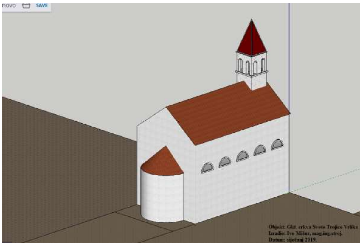
Slika 2. 3D model gkt. crkve Svete Trojice u Vrlici (stražnja strana)