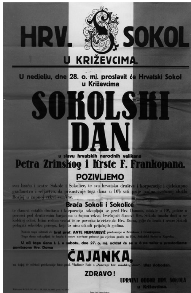
Slika 9. Plakat za obilježavanje Sokolskog dana 1929. godine. GMK–9056.

Već na početku 1928. godine održana su tri predavanja. Predavači su bili Ante Neimarević, Ljubomir Maštrović i Ana Maštrović, no nemamo podatke o temama. 77 Krajem godine održana su još dva predavanja. Prvo od njih bilo je 29. studenoga, kada je dr. Gregurek održao predavanje pod naslovom »O tuberkulozi«, dok je drugo bilo 9. prosinca, kada je Ljubomir Maštrović održao predavanje pod naslovom »O Stjepanu Radiću i sokolstvu«. 78 Tijekom veljače održana je pokladna reduta, što je, može se zaključiti, postao tradicionalan događaj. 79 Veliko priznanje Društvo je dobilo na godišnjoj skupštini Župe Preradović održanoj u Bjelovaru 1. travnja 1928. godine, kada je proglašeno najboljim u Župi i kada je odlučeno da 1929. godine pov-