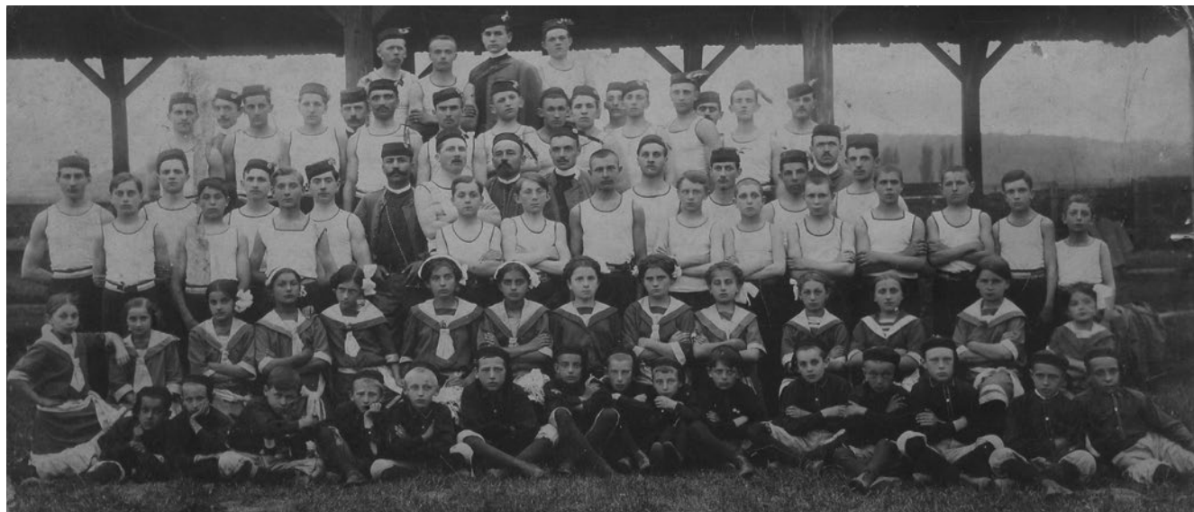
Slika 2. Vježbači na Sajmištu 1913. godine. Posljednja javna vježba prije početka Prvoga svjetskog rata. GMK–6658.

četiri takva tečaja: dva u naselju Podgajec, a po jedan 1914. godine u naseljima Brckovščina i Đurđić.