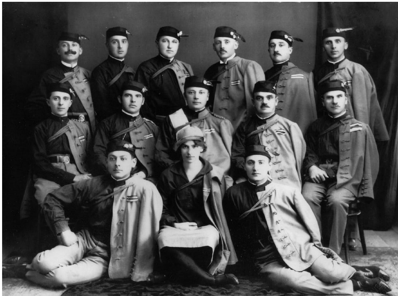
Slika 10. Članovi Upravnog odbora Hrvatskog sokola u Križevcima 1929. godine. GMK–8181.

dom 25. obljetnice osnivanja Župe bude domaćin Župskog sleta. 80