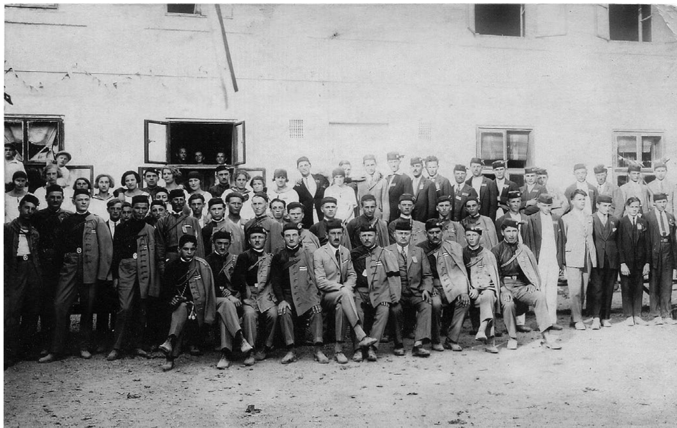
Slika 7. Članovi Hrvatskog sokola u Križevcima oko 1926. godine. GMK–8179.

početkom 1923. godine dostigao broj od 320 članova. Krajem sljedeće godine članova nije bilo toliko mnogo, točnije bilo ih je 312, no broj se krajem 1925. godine povećao na 329 članova, što je bio najveći broj članova ikada. 70