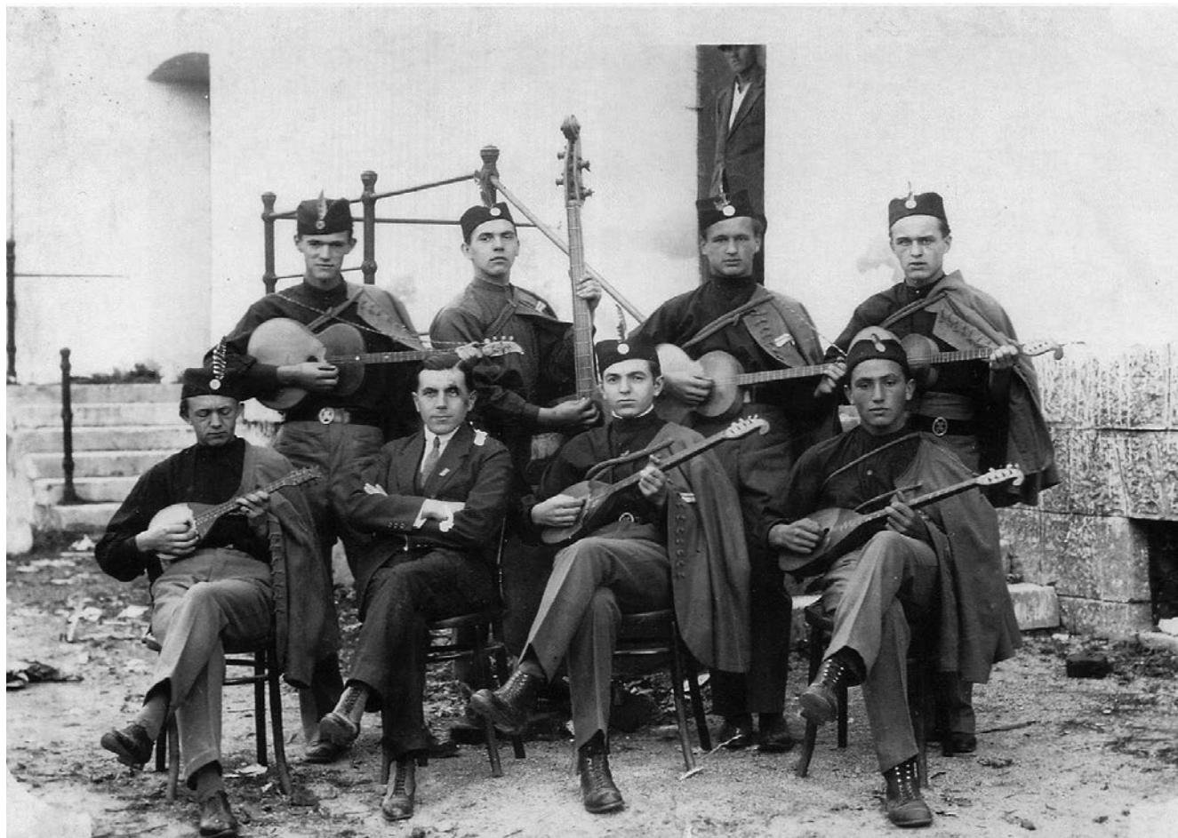
Slika 6. Članovi tamburaške sekcije Hrvatskog sokola u Križevcima oko 1925. godine. GMK–8176.

osnovano društvo Hrvatskog seljačkog sokola, zatim u Svetom Ivanu Žabnu (13. 9.) i u Cirkveni (27. 9.).