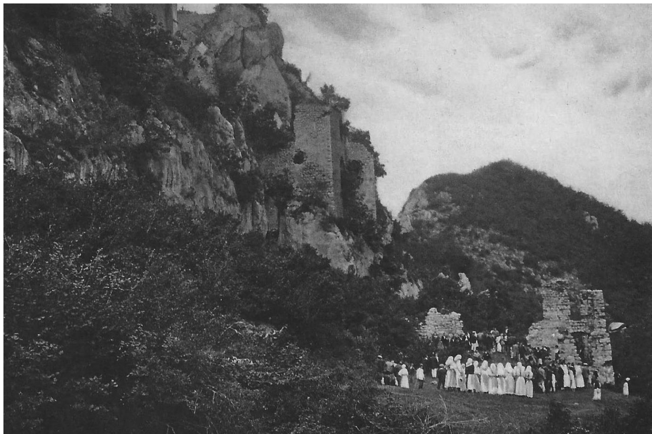
Slika 5. Iskopavanje zemlje na Kalniku za potrebe podizanja sokolske mogile u zagrebačkom parku Maksimir 1925. godine. GMK–6001.

diljem Hrvatske obilježavala 1000. godišnjica Hrvatskog kraljevstva, proslavi te značajne obljetnice priključio se s nekoliko akcija i Hrvatski sokol u Križevcima. Već 31. siječnja otac Mijo Cuić, nadžupnik iz Duvna, održao je predavanje »O 1000 godine hrvatskog kraljevstva i značenju Duvanjskog polja«. Dvorana je bila dupkom puna. Mjesec dana kasnije, točnije 1. ožujka, društvo Tomislav je na poziv Hrvatskog sokola u Križevcima izvelo kraću predstavu O duvanjskom polju . 65 Početkom srpnja križevački su sokolaši zajedno s ostalim križevačkim društvima započeli službeno obilježavanje 1000. godišnjice Hrvatskog kraljevstva, dok su