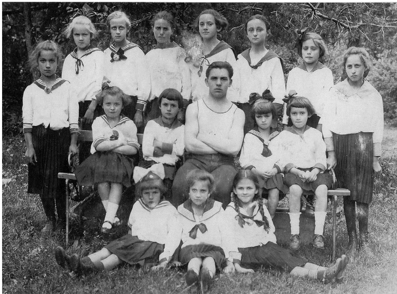
Slika 8. Vježbačice Hrvatskog sokola. GMK–8180-2.

Hrvatskom domu održana dva predavanja. Najprije je Marko Vunić govorio o Veneciji, nakon čega je član Ivan Belan održao predavanje pod naslovom »Natrag k lijepim starim vremenima«. Uz to, starješina Maštrović je 16. listopada u Hrvatskom domu održao predavanje naslovljeno »O sokolskoj disciplini«. Nakon svih predavanja održavale su se čajanke.