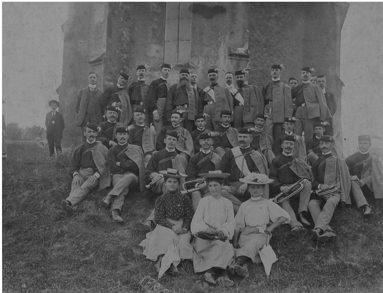
Slika 1. Fotografija članova Hrvatskog sokola u Križevcima iz 1905. godine. GMK–6661.

ga je vodio do zabrane rada u ljeto 1914. godine. Društvu je već pri osnivanju pristupilo više od 100 članova, i taj se broj do izbijanja Prvog svjetskog rata uglavnom povećavao. Vježbe su se održavale dva puta tjedno, i to najčešće u prostoru križevačke knjižnice, kasnije Narodnog, a danas Hrvatskog doma. Najbolji vježbači sudjelovali su na javnim vježbama i sletovima koje je Društvo organiziralo gotovo svake godine, zatim na javnim vježbama koje su organizirali druga sokolska društva, kao i na sokolskim sletovima Župe Preradović. Jedan takav slet organiziran je i u Križevcima 7. i 8. rujna 1912. godine, a na njemu su osim sokolaša iz Župe Preradović nastupili i članovi sokolskih društava iz Sveto- ga Ivana Zeline, Kloštar-Ivanića, Karlovca i Zagreba. 14