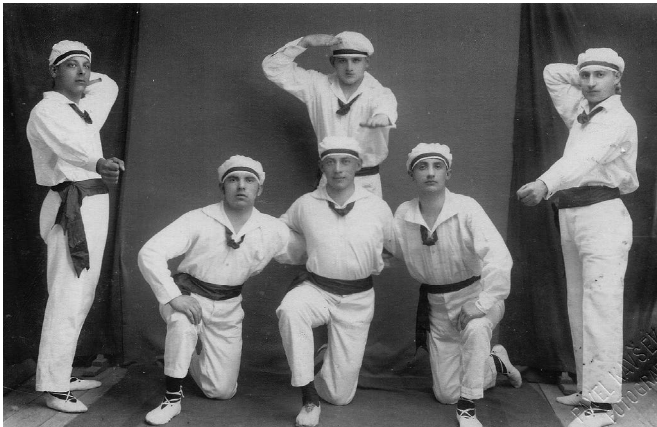
Slika 4. Fotografija šestorice članova Hrvatskog sokola u Križevcima odjevenih u mornarske uniforme. GMK–8175.

Križevački su sokolaši te 1924. godine sudjelovali na javnim vježbama u Koprivnici (15. 6.), Karlovcu (3. 8.) i Dubravi pored Vrbovca (24. 8.), kao i na župskom sletu u Daruvaru (5. 7.) te na sletu Župe Fonove u Zagrebu (22. 6.). 61 Tijekom 1924. godine održane su i dvije akademije. Prva od njih, koja postaje tradicionalna, održana je 30. travnja povodom obilježavanja godišnjice pogibije Zrinskog i Frankopana. Ujutro u 8 sati održana je misa na kojoj su prisustvovali malobrojni članovi Društva. Nakon toga je održan program s jednostavnim vježbama te glazbenim i scenskim prikazima u kojima su sudjelovali i članovi Pjevačkog društva »Kalnik«. 62