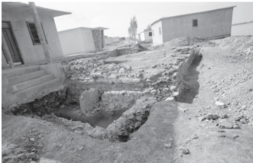
SLIKA 6. Pogled na začelje i susjednu arhitekturu mauzoleja na položaju Kulina