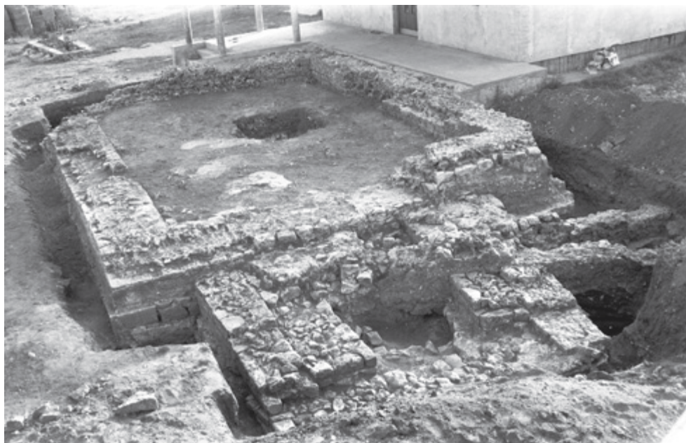
SLIKA 5. Pogled na mauzolej otkriven na položaju Kulina u Vrsima prilikom istraživanja 1972.