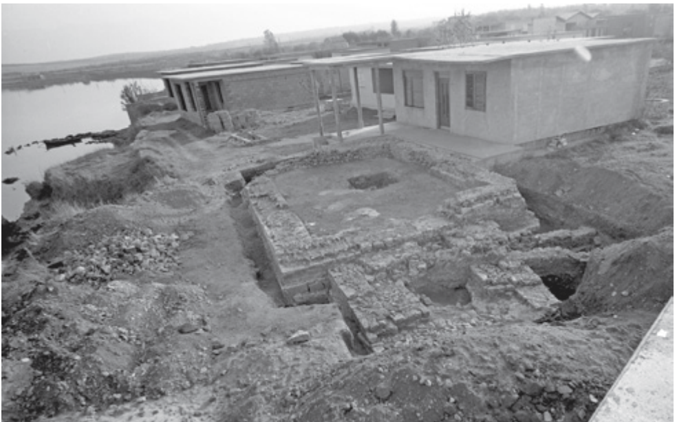
SLIKA 8. Pogled na arhitekturu otkrivenog mauzoleja i okolni krajolik