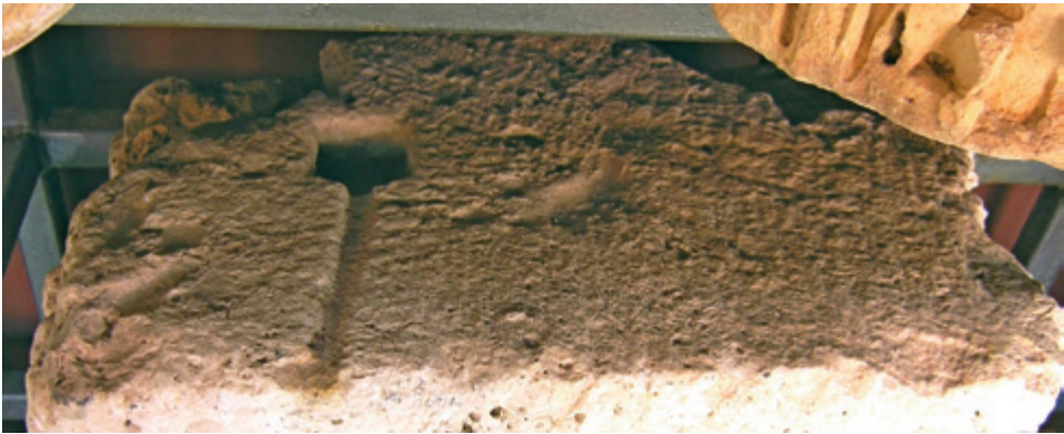
SLIKA 11. Pogled na detalj gornje plohe elementa trabeacije s utorom i kanalom za olovo

na koju je položen pa je utor danas teško napipati i prepoznati, no prisutnost mu je neupitna. U izvornom stanju sačuvani su gornji horizontalni i vrh lijevog vertikalnog ruba stranice s natpisom. Ti dijelovi formiraju gornji lijevi ugao natpisnog polja, sugerirajući da je ono bilo bez uobičajenog ukrasnog okvira i da je danas sačuvano u punoj visini.