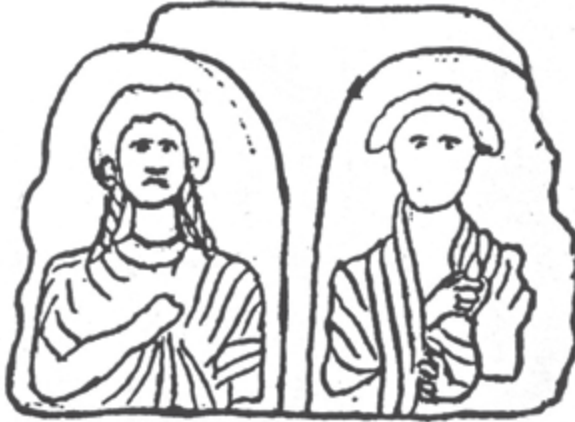
SLIKA 2. Ugradbeni reljef iz Enone na crtežu Mijata Sabljara (preuzeto iz: D. Maršić, Ugradbeni i građevni portretni reljefi u Istriji i Dalmaciji , 2009., Sl. 5)

za ugradnju. 33 Dva sigurno atribuirana enonska ugradbena reljefa potječu iz približno istog vremena, malo prije ili oko sredine 1. st. po Kr., što implicira da se najkasnije od toga vremena na nekropolama Enone uzdižu i monumentalna grobna zdanja.