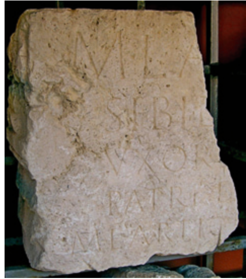
SLIKA 10. Pogled na pročelje elementa trabeacije s natpisom obitelji Lartius