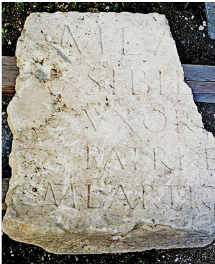
SLIKA 12. Pogled na element trabeacije s vidljivom donjom plohom i utorom za kapitel

Natpis je raspoređen u pet redaka i pisan monumentalnom kapitalom čija se visina smanjuje od prvog prema zadnjem retku, od početnih 11 do završnih 5,5 cm. Unutar teksta su interpunkcije koje imaju trokutasti, ali negdje poprimaju gotovo kružni oblik. U čitanju i razumijevanju izvorne strukture natpisa nema nekih značajnijih poteškoća, što nas dovodi do makar približne rekonstrukcije polja i njegovih dimenzija.