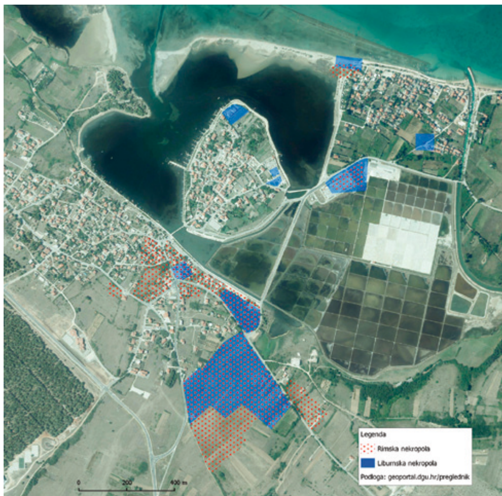
SLIKA 1. Raster predrimskih i rimskih nekropola Enone (preuzeto iz M. Dubolnić Glavan, Civitas Aenona , 2015., 97, Sl. 37)

Instalacije za pohranu spaljenih kostiju i pepela s vremenom će se kao kružni ili kvadratni recipijenti pojaviti i unutar nadgrobnih spomenika, osobito tzv. liburnskih cipusa i nadgrobnih ara. 13