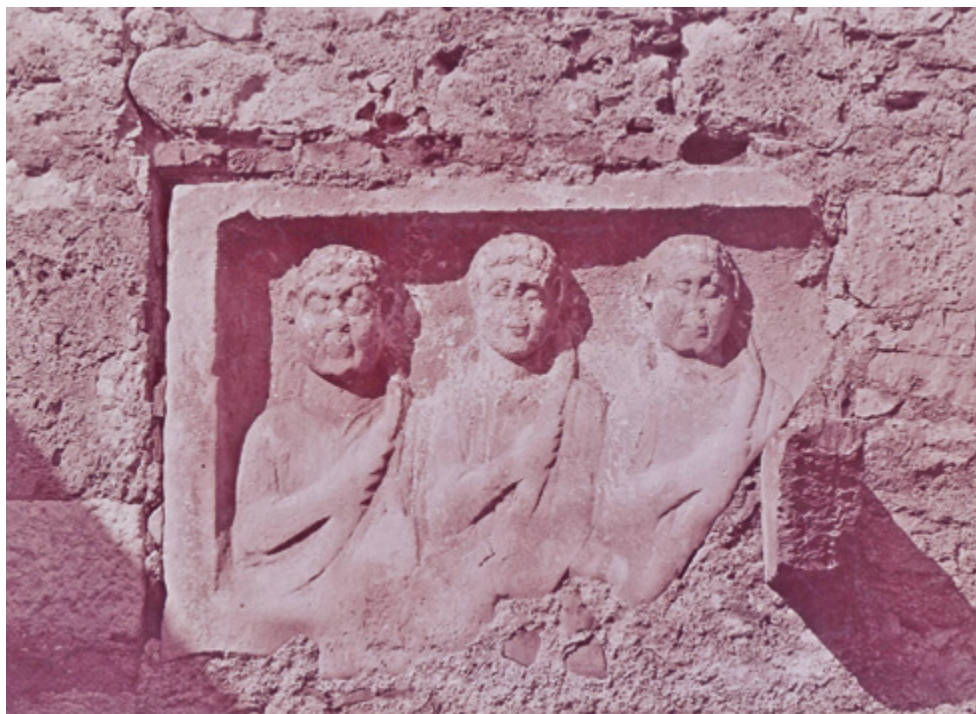
SLIKA 13. Ugradbeni reljef uzidan u kući Tartaro u Ninu početkom 20. st.

spoznaja o postojećima više nego dragocjena. Pripadnost skupini ugradbenih reljefa pretpostavljena je i za reljef s portretom mlađeg togata oštećenih partija lica uzidan u kuću Tartaro u Ninu. Do prije nekog vremena spomenik je bio vidljiv u cijelosti, iako debelo ožbukanih rubova (Sl. 14), no danas je nažalost zakriven ugradnjom drvenih vrata (Sl. 15). Prema usmenoj predaji reljef je nekoć prikazivao tri muška lika, a na jednofiguralni format sveden je nakon požara. 53