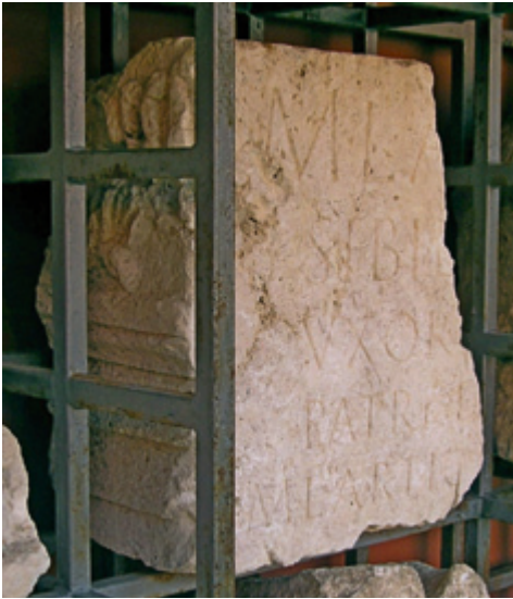
SLIKA 9. Pogled na ugaoni dio elementa trabeacije s natpisom obitelji Lartius (foto: autori)