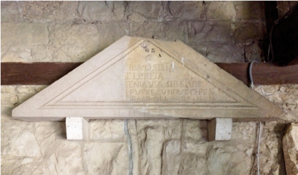
SLIKA 17. Zabat distilne edikule iz Salone

Edikula Larcija očito je bila samostojeća građevina, ali ne možemo isključiti mogućnost da je stajala i u nekom složenijem arhitektonskom kontekstu, npr. da se na nju naslanjao perimetralni zid grobnog prostora.