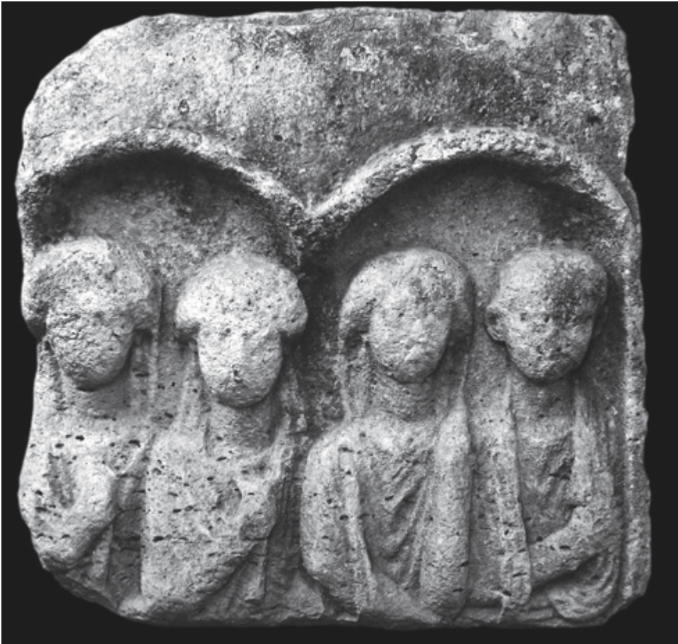
SLIKA 4. Ugradbeni reljef s prikazom četiri pokojnika iz Muzeja ninskih starina

mauzoleja. 37 Iako je riječ o primjercima problematičnog podrijetla, prilično pouzdani podatci o mjestu nalaza barem tri, ako ne i četiri primjerka dobiveni su pregledom Arhive dr. L. Jelića. Kao jedan od prvih istraživača ninskih groblja Jelić se osvrnuo i na nalaze spomenutih skulptura: „Pred Ninom na današnjoj zadarskoj cesti kod Ljuljevaca bilo je nekoliko monumentalnih grobnica. Djelomice su im podgradci još pod zemljom s bokova podrovani od ninskih starinarskih grobodera; česti monumentalnih natpisa jamče nam da su bile ovećih izmjera i ukusno arhitektonski dekorovane. Spomenuti ćemo samo 3 sirenska kipića od kojih jedan je od mješovitog sirensko-lavskog tipa što su