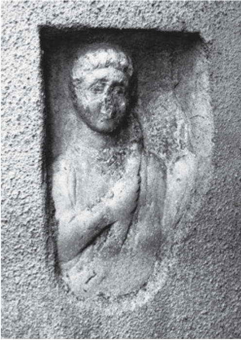
SLIKA 14. Fragment ugradbenog reljefa u kući Tartaro 2002. godine