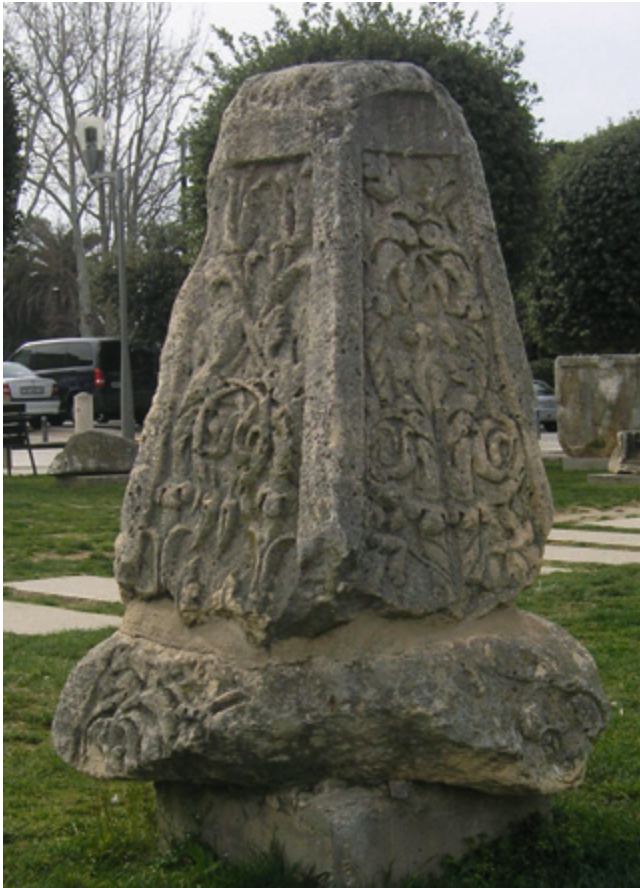
SLIKA 18. Piramidalno krunište monumentalne grobnice iz Zadra

vijenca, zabata i dr. elemenata ipak stvarali iluziju pravih građevina. 94 Nekada su pak stajali u visini vidnog polja na manjim, čvrsto zidanim grobnicama, od kojih su neke i sačuvane ili rekonstruirane s većom sigurnošću. 95 Neki drugi kontekst teško da može doći u obzir, npr. unutar kolumbarija, jer su naši primjerci višefiguralni i masivne poprečne koncepcije, što ne odgovara gradskorimskim primjercima reljefa koji dolaze iz takvog konteksta.