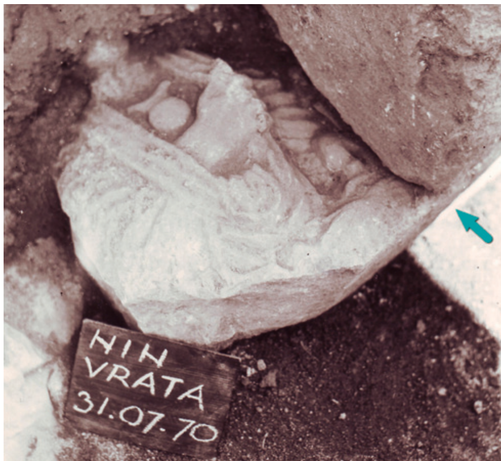
SLIKA 16. Pogled na fragment nadgrobnog reljefa pronađenog na položaju Dvorine u Ninu

i desni dio glave bio odlomljen jer se lijevi dio neprirodno izdiže i samo su na njemu vidljivi snažni pramenovi (Sl. 13). Taj detalj ipak ostaje nepoznanica jer se samo temeljem priložene fotografije o njemu ne može sa sigurnošću raspravljati. Na temelju modnih i stilskih karakteristika reljef se može datirati u period od kraja 60-ih do 90-ih godina 1. st. Takva datacija je u čvrstom suglasju i sa stilom drapiranja toge, koji zbog izostanka umbra „U“ oblika a priori govori protiv ranijeg postanka. 62