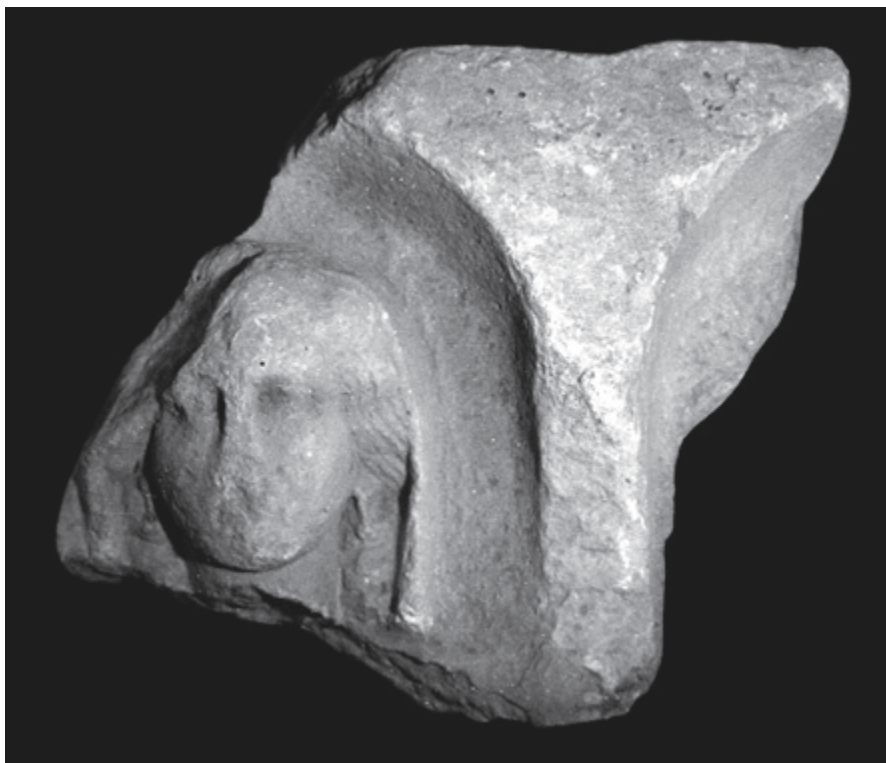
SLIKA 3. Fragment ugradbenog reljefa s crteža Mijata Sabljara u Arheološkom muzeju Zadar

Arhitekturi grobnih areala i dekoraciji pojedinačnih spomenika pripada i šest skulptura sfingi. 36 U funerarnom kontekstu sfinge obično imaju apotropejsku ulogu čuvara groba i besmrtnih duša pokojnika. Skulpture sfingi mogle su stajati u paru na uglovima grobnih areala, u funkciji akroterija stela i kompozitnih spomenika, poklopaca urni, ali i u sklopu kruništa ili podija