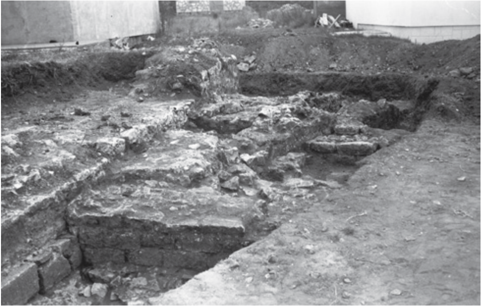
SLIKA 7. Pogled na prilazni dio mauzoleja na položaju Kulina