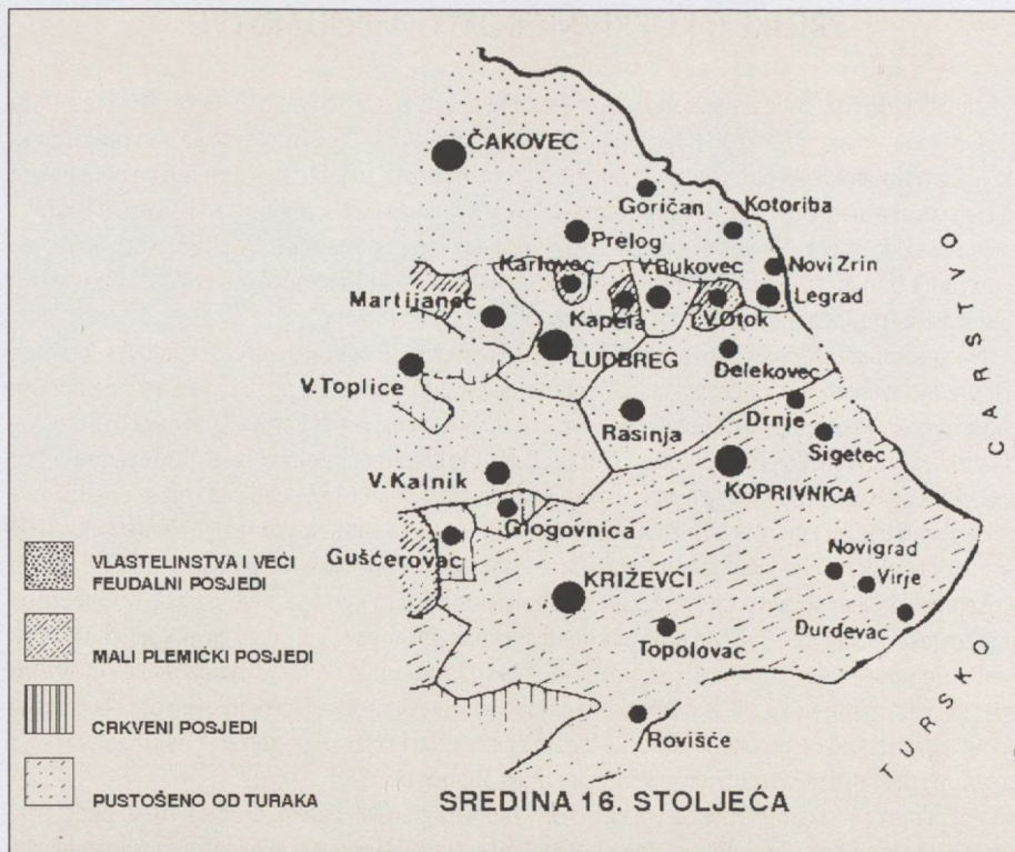
Prostorni raspored feudalnih posjeda u Podravini u vrijeme borbi s Turcima

a gotovo svi novi doseljenici živjeli su bijedno.