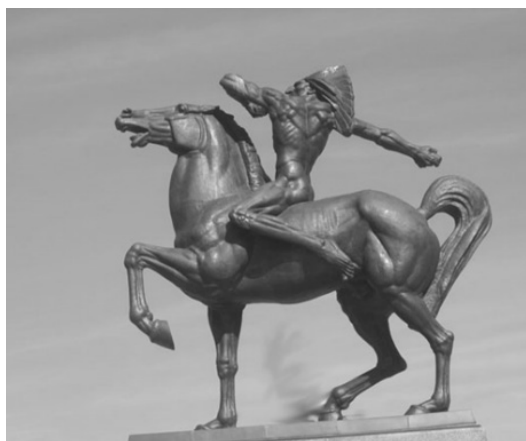
Slika 2. Spomenik Indijancima u Chicagu