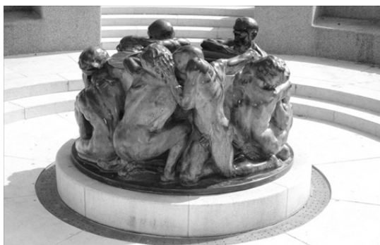
Slika 3. Zdenac života