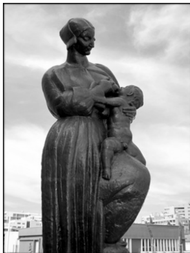
Slika 1. Majka i dijete

U ovom istraživanju upotrjebljena su tri značajna djela Ivana Meštrovića: „Majka i dijete“, „Spomenik Indijancima u Chicagu“ i „Zdenac života“