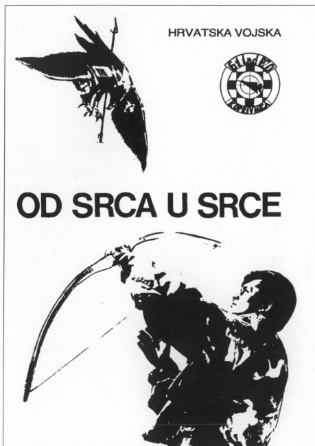
Plakat postrojbe lad PZO, današnji 2. trd PZO Koprivnica.

potrebne stvari. Iako ponekad prepušteni i protupješačkoj borbi, pripadnici divizijuna znali su da je uvijek uz njih njihovo zapovjedništvo i logistika. A kad govorimo o opremanju, moramo spomenuti i objekte u kojima se divizijun sada nalazi. Oni koji su na početku rata "upali" u vojarnu znaju da su to bile trošne barake u kojima je bilo skladište "rashodovane intendantske opreme" bivše jugovojске. Uglavnom vlastitim radom, uz veliku pomoć mnogobrojnih donatora, koprivničkih i đurđevačkih poduzeća, pripadnici divizijuna uspjeli su stvoriti svoj "mali raj".