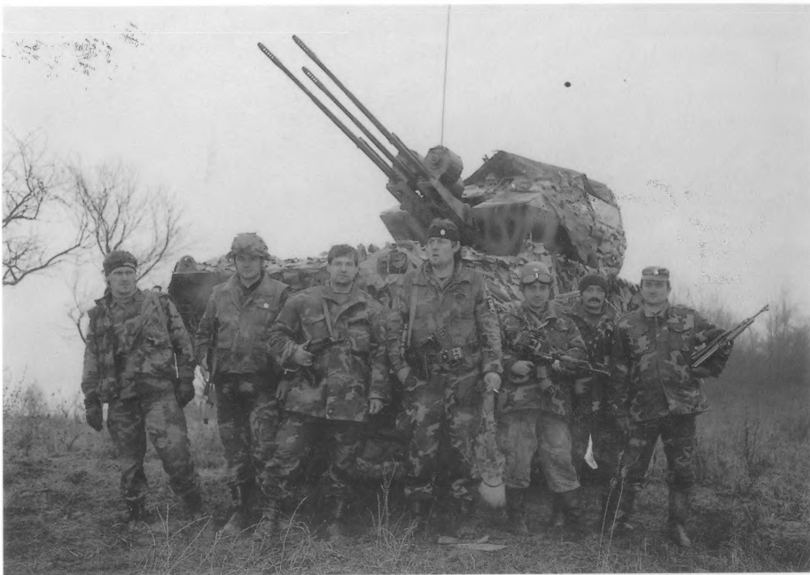
Studeni 1991. Mjesto Popovac, Zapadna Slavonija.

"haubičari" su nas iznenadili s pečenim janjcem i pivom jer su bili oduševljeni našim načinom djelovanja. Narednih dana bit će još mnogo naleta neprijateljskih zrakoplova, ali letjet će sve više čime će njihova preciznost biti sve manja. Osjećamo da ih je strah spustiti nam se u domet. Ipak tu je 61. lad PZO-a."