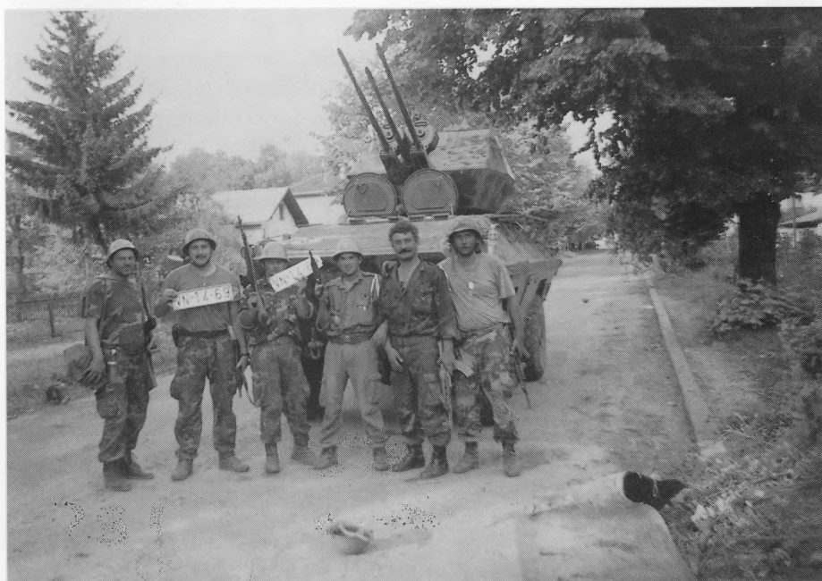
Kolovoz 1995. "OLUJA". Pripadnici 2. trd-a PZO prvi su ušli u Dvor na Uni.