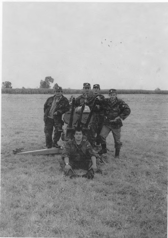
Listopad 1991. Jedan od paljbenih položaja (Molve) za obranu Koprivnice

koprivnički protuzrakoplovci budno motre na nebo iznad Koprivnice i Podravine. Možda je upravo to odvrtilo agresora da više nikada nije ni pokušao djelovati po našem kraju. Na sreću, prvi napad iz zraka bio je i posljednji, ali 61. lad PZO-a bio je uvijek spreman odvratiti od napada i uzvratiti na napad. Listopad 1991. godine maksimalno je korišten za obučavanje, uvježbavanje i osposobljavanje. Svakog trenutka mogla je stići zapovijed da se krene na front. I nije se moralo dugo čekati.