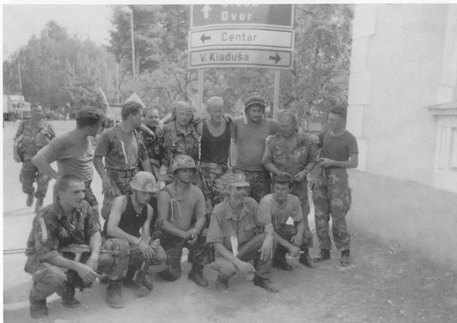
Kolovoz 1995. "OLUJA". Pripadnici 2. trd-a PZO u Glini.