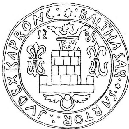
Crtež sudačkog pečata iz 1589. po L. Brozoviću (1978.)