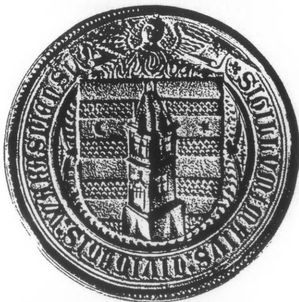
Srebrni pečatnjak (veliki) varaždinske gradske općine iz 1464. godine.