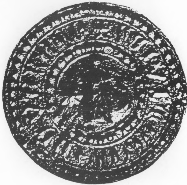
Pečat varaždinske gradske općine iz 1424. godine.