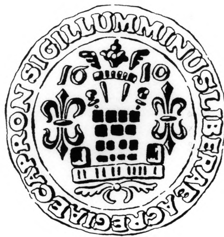
Crtež malog pečata iz 1610. po F. Horvatiću (1992.) Crtež izradio J. Gregurić (1992.)

Na oba pečata slika tornja je simbol ostvarene slobode srednjovjekovne općine. Tijekom vremena uz sve utvrđene promjene i prerade pečatnih slika 33 , koprivnički i varaždinski toranj su ostali na njima. Ništa se nije promijenilo ni u vrijeme 19. i 20. stoljeća kada su se u oba grada uklanjali nasipi, zidovi, opkopi, bedemi, kule i gradska vrata. Kao što su ostali znakovi, vidljivo je na primjeru varaždinskog pečata, mijenjali veličinu i oblik 34 tako su se neki na koprivničkom potpuno izgubili 35 . Slika tornja na pečatima srednjovjekovnih općina Koprivnice i Varaždina je dokaz njihovog sličnog povijesnog razvoja koji je bio označen posjedovanjem povlastica slobodnog kraljevskog grada.