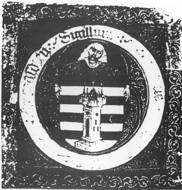
Sitnoslikarija u glavi isprave o pravu na izradu i korištenje pečata varaždinske gradske općine iz 1464. godine.