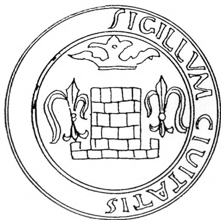
Crtež oštećenog pečata iz 1545. po L. Brozoviću (1978.)