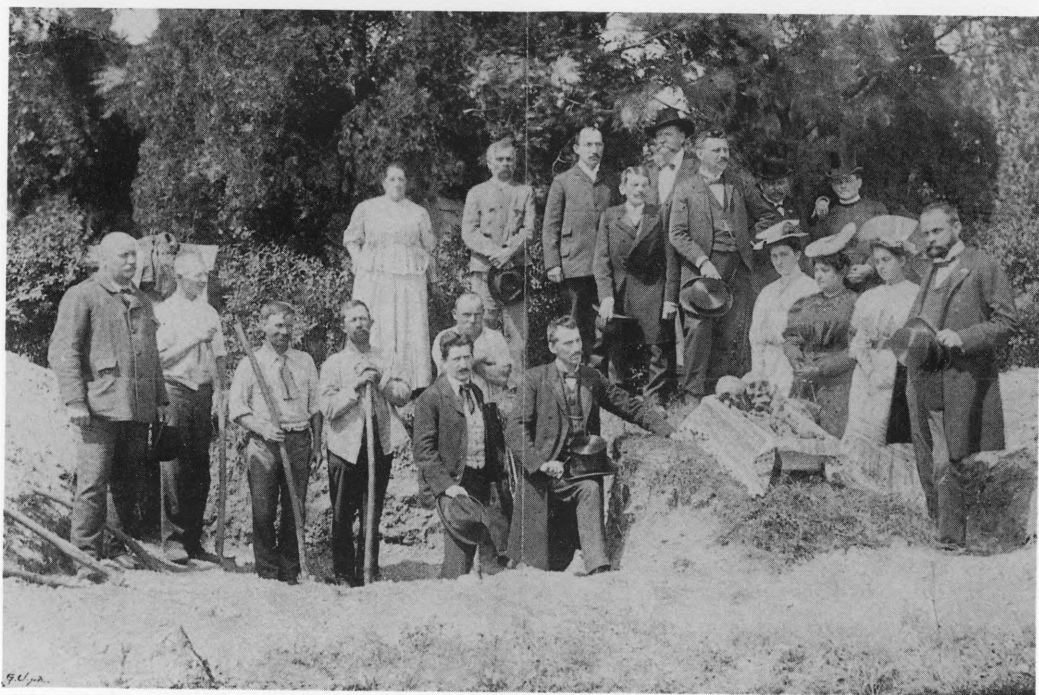
Ekshumacija kostiju Zrinskoga i Frankopana 20. VII 1907. u Bečkom Novom Mjestu. Iz knjižice "Kosti Petra Zrinskoga i Frana K. Frankopana".