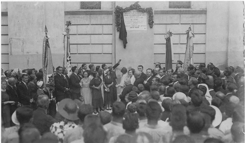
Svečano otkrivanje spomen-ploče biskupu Angeliku Bedeniku 29. VI 1935. na župnoj crkvi sv. Nikole u Koprivnici, u organizaciji Hrvatskoga pjevačkog društva Podravac i Braće Hrvatskog Zmaja.