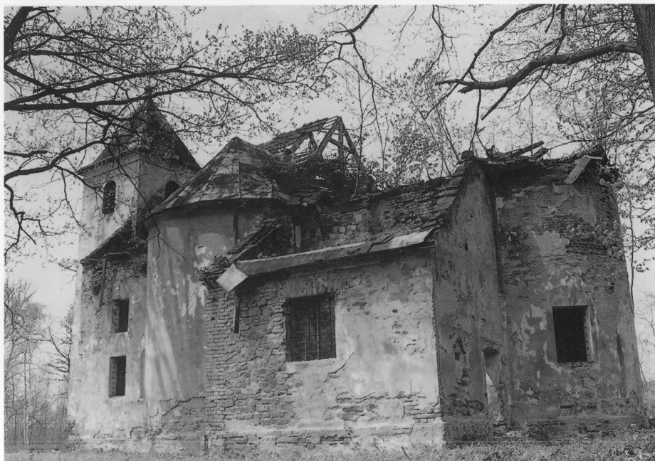
Kapela "BLAŽENE DJEVICE MARIJE" u Križančiji, 1731.