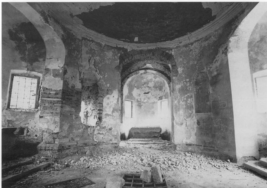
Unutrašnjost kapele (Foto: Marijan Grobenski, 1995)