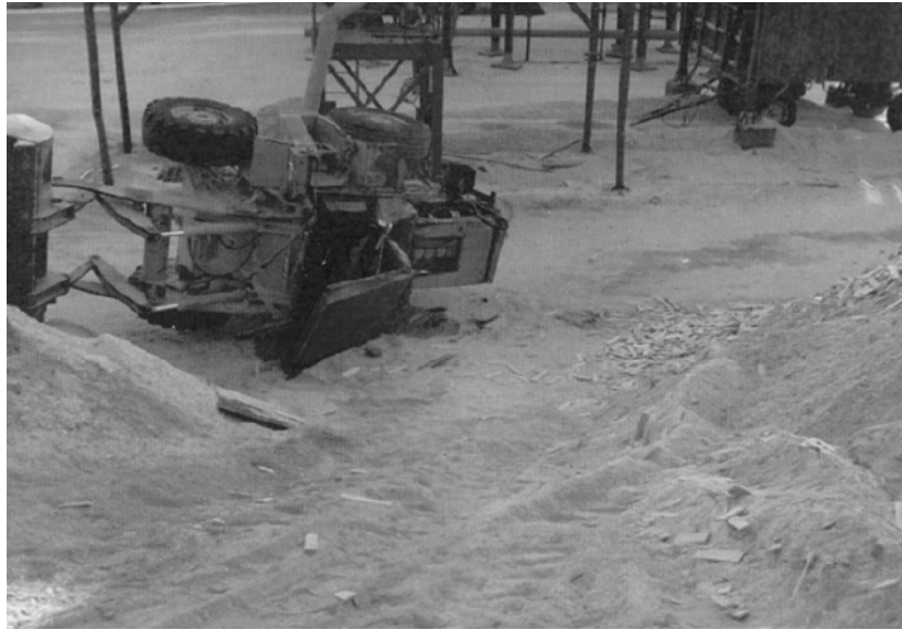
Slika 1. Prevrnuti utovarivač u podnožju deponije piljevine