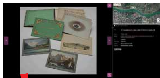
Topoteka Osijek - Tvrđa

Tomu u prilog govori i popularizacija kulturološkog prezentiranja znanstvene teorije i povijesne baštine putem online Topoteke Osijek – Tvrđa, projekta koji je iniciran 2017. godine u suradnji s ICARUS-om Hrvatska, kako bi se osječka povijest i kultura prostora sačuvala i postala dostupna javnosti. Ova virtualna zbirka nastala je interakcijom s lokalnim ustanovama, udrugama, zajednicom i autoricom monografije o osječkoj Tvrđi, s namjerom populariziranja, zaštite i javnog predstavljanja njezina istraživanja Nutarnjeg grada. Kao jedan od suvremenih alata za stvaranje mrežnih arhiva lokalne povijesti i/ili teme, digitalna platforma Topoteka je i u slučaju prezentacije Nutarnjeg grada poslužila tome da se arhivski izvori, fotografije, dokumenti i svi drugi materijali koje je Helena Sablić Tomić prikupila obrade u skladu s relevantnim međunarodnim standardima i javno objavljuju. Osječku Topoteku uređuje i vodi stručni tim Akademije za umjetnost i kulturu u Osijeku Slađana Pupovac, mag. cult., Marta Radoš, prof. i dipl. knjižničarka i dr. sc. Hrvoje Mesić, uz stručnu pomoć dr. sc. Vlatke Lemić, predsjednice ICARUS-a Hrvatska i višeg kustosa Muzeja Slavonije u Osijeku, Marka Grgura Ivankovića, prof. U prvoj fazi rada je digitalizirano i obrađeno 96 jedinica, a plan je nastaviti nadopunjavati Topoteku novom građom, kako bi suvremenom informacijskom tehnologijom i procesom digitalizacije osigurali vidljivost ovoga gradiva poštujući načelo demokratičnosti – dostupnost