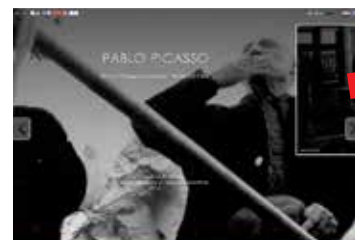
Virtualna izložba Pablo Picasso – 80. rođendan, Vallauris 1961

Izložba je bila medijski dobro popraćena, promovirana i kroz izlaganja na stručnim skupovima, a sljedeće, 2014. godine, uvrštena je na portal Europeane među dvadesetak virtualnih izložbi iz cijele Europe.