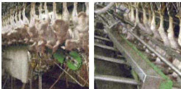
▼ Slika 2. Završno pranje