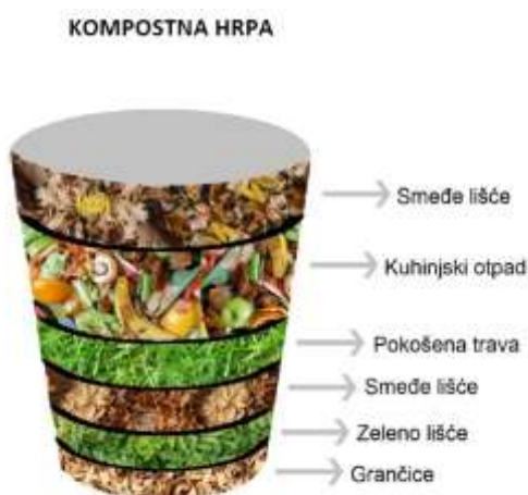
Slika 3. Slojevi biootpada u komposteru

Nezreli kompost nema tamnu boju, kiselkastog je mirisa ili miriše na gljive. U njemu se mogu naći ostaci lako razgradivih tvari poput lišća, ostataka povrća i sl. Takav kompost mora još neko vrijeme odležati (Čistoća Dubrovnik, 2016).