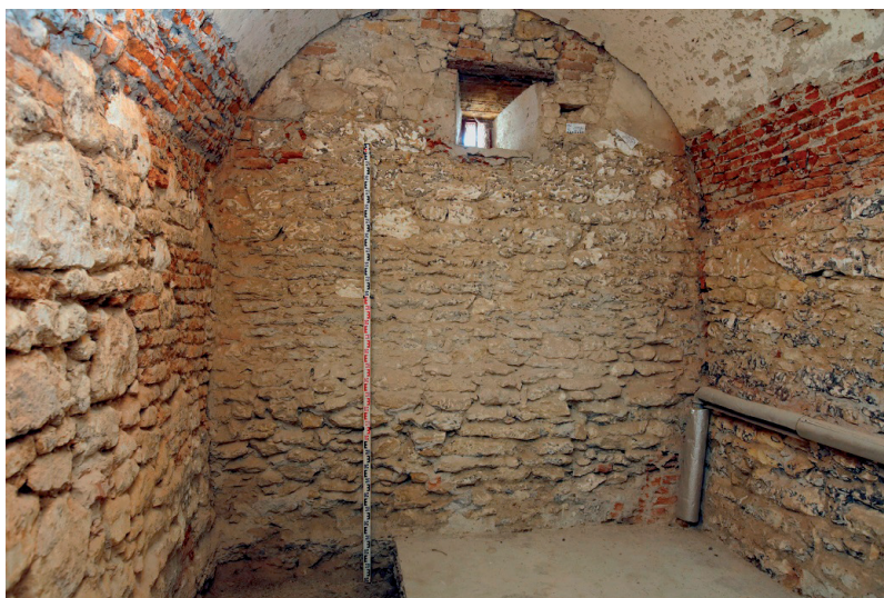
Slika 6. Ostatak sjevernog gradskog zida u zgradi žitnice

sukladno tome i kameni blokovi postaju manji. Budućim konzervatorsko-restauratorskim istraživanjima na zgradi žitnice i na tom segmentu zida možda će se otkriti više podataka o pojedinim građevinskim elementima koji bi bili zanimljivi za usporedbu s likovnim prikazima i povijesnim izvorima. Linija sjevernog gradskog zida kreće od smjera žitnice prema Bakačevoj ulici ( platea muri civitatis ) 21 gdje su arheološki potvrđeni ostaci zida i dijela sjeveroistočne kule. Temeljni dio zida pronađen 2003. godine (sl. 7) u Bakačevoj ulici kbr. 2 prema načinu gradnje pokazuje sličnost s prethodno opisanim ostacima gradskih zidina. Građen od kamena lomljenca vezanog žbukom pozicioniran je u smjeru istok-zapad, najveće je do sada zabilježene širine od 160 cm, sačuvan u visini od 80 cm. Temelji zida u istoj ulici potvrđeni su na još dvije pozicije arheološkim nadzorom 1996. godine, a osim njih pronađen je i ostatak poligonalne sjeveroistočne kule na uglu Bakačeve i Šenoine ulice ispod nekadašnje zgrade Tive. 22 Jedini danas još uvijek sačuvan dio sjevernog obrambenog sklopa predstavljaju sjeverna ili bečka gradska vrata ( Porta civitatis superior ), tzv. Lisakova kula.