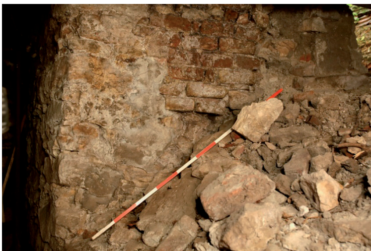
Slika 10. Ostatak istočnog gradskog zida