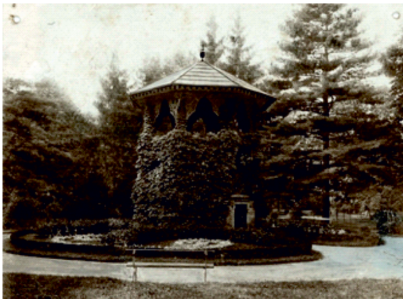
Slika 9. Jugoistočna kula u gradskom parku u 19. st.

potvrđen. Njegov pronalazak olakšati će lociranje ugaone kule koja se nalazila na sjecištu južnog i istočnog gradskog zida (sl. 9), a u kojoj se još u 19. st. nalazila slastičarnica. 25