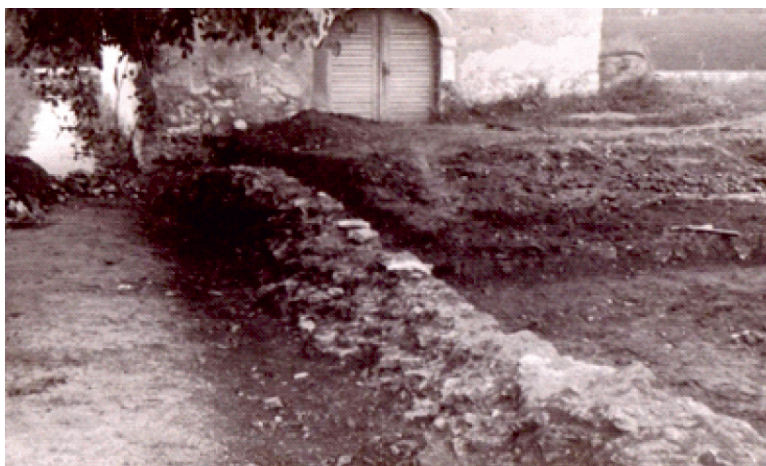
Slika 5. Ostatak sjevernog gradskog zida ispred zgrade žitnice 1941. godine

Sjeverni gradski zid već je prilikom sustavne razgradnje u 19. st. uništen i pregrađen. 18 Njegovi ostaci bili su vidljivi prilikom uređenja okoliša Starog grada 1941. godine ispred ulaza u zgradu žitnice (sl. 5). Tada je jedan segment tog zida i iskopan, a uz njegovo južno lice pronađena je ulazna kula s upisanom starijom kulom koja je srušena u 19. st. zbog opasnosti od rušenja uslijed djelovanja klizišta vodene grabe u njezinoj neposrednoj blizini. 19 Ovaj segment zida ispitan je naknadno revizijskim iskopavanjem 1971. godine u svrhu arhitektonskih ispitivanja kada su provedena detaljnija mjerenja pri čemu se ustanovilo da su obje strane lica zida uništene, a debljina mu je varirala od 80 do 100 cm. 20