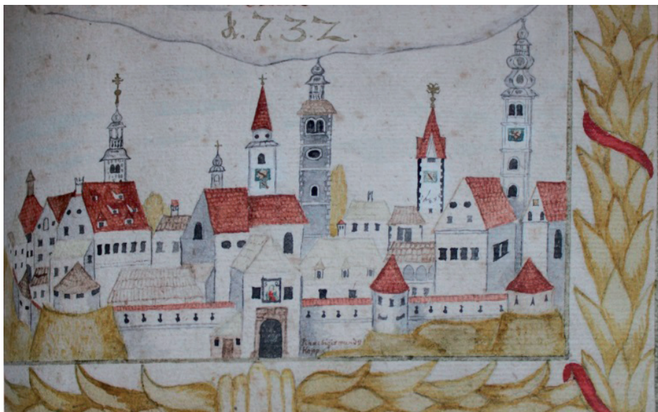
Slika 1. Veduta grada Varaždina iz 1732. godine, autora Sigismunda Koppa, (snimio: Davor Puttar. Gradski muzej Varaždin)

iz kojih crpi ta saznanja. 6 Izvjesno je da se od 1516. godine, nakon odluke kralja Ludovika II. da se kraljevski porez utroši u gradnju gradskih zidina, vrše na njima građevinski radovi. Voditelj radova tada je bio Pankracije Jagersperger, a iz njegovih trogodišnjih izvještaja saznaju se podaci o materijalu i vrsti radova pri gradnji zidina. Spominju se kruništa zidina, krov nadstrešnice i drveni unutarnji hodnici za kretanje vojske, svi elementi vidljivi na veduti Sigismunda Koppa iz albuma Društva Blažene Djevice Marije iz 1732. godine koja grad prikazuje s južne strane (sl. 1). Navodi se visina zida od 3 i 4 klaftre, što bi iznosilo između 5,5. i 7,5 metara. 7 Ukupna dužina zidina koja je iznosila više od 886 m izmjerena je prilikom razgradnje u 19. st., s tim da sjeverna strana nije bila uračunata jer je već tada bila razgrađena i dijelom pod kućama. 8 Od čitavog nekadašnjeg opsega gradskih zidina vidljivi i prezentirani ostaci danas su poprilično oskudni.