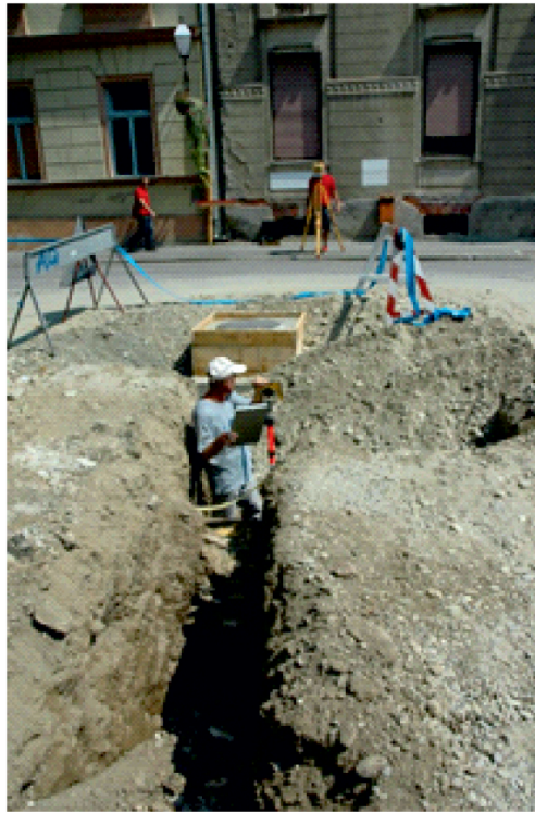
Slika 8. Geodetska izmjera istočnog gradskog zida 2015. godine

Stanje zida u kojem je pronađen bilo je loše, a dodatno je na njegovoj sačuvanoj gornjoj površini ranijim infrastrukturnim radovima bez arheološkog nadzora postavljena cijev. Uslijed brzine radova koje su diktirali rokovi, zid nije bilo moguće detaljno ispitati. Ono što je bilo izvjesno je njegova tvrdoća zbog koje su uostalom i ostavljeni temeljni dijelovi gradskih zidina ispod razine današnjih ulica jer materijal nakon razbijanja nije bio pogodan za sekundarnu upotrebu. 24 Ovaj nalaz temelja zida važan je za točno praćenje pravca gradskih zidina, a isto- vremeno je jedini dio od sve četiri strane gradskih zidina koji do sada nije bio