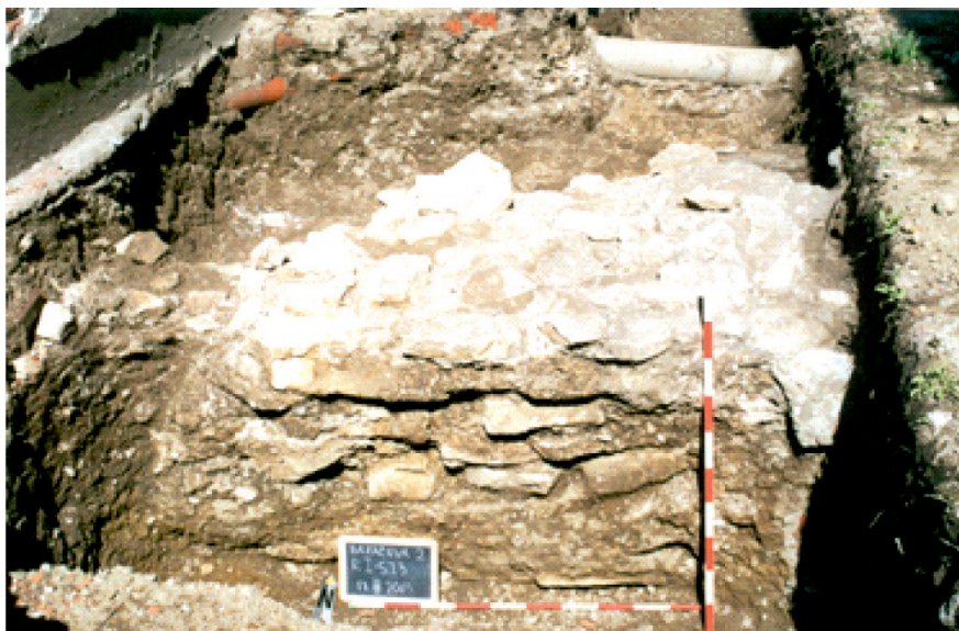
Slika 7. Ostatak sjevernog gradskog zida 1996. godine