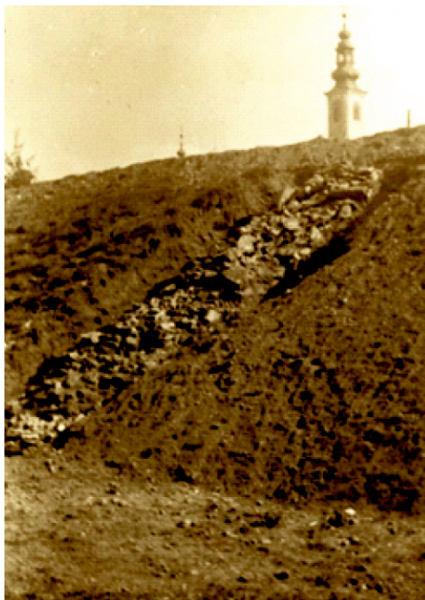
Slika 3. Zapadni gradski zid otkriven 1941. godine

srušena. Arheološki kula još nije potvrđena, a danas je vidljiv na toj poziciji samo kružni povišeni plato. 16