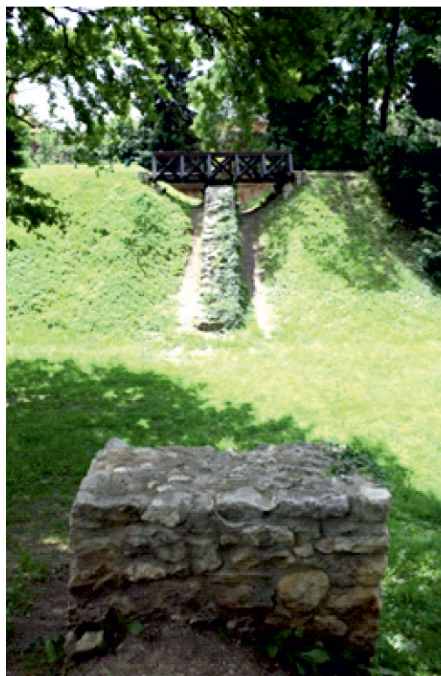
Slika 4. Prezentirani dio zapadnog gradskog zida

Na mjestu današnjeg opkopa nedostaje dio zapadnog gradskog zida koji je vrlo vjerojatno srušen u drugoj polovici 16 st. prilikom kopanja obrambene grabe. Koliko je taj zid stariji od zemljanog bedema ili koliko je istodobno bio s njim u funkciji nažalost nije arheološki potvrđeno. 17 Zapadni gradski zid jedini je segment gradskog zida koji je konzerviran i prezentiran za javnost. (sl. 4).