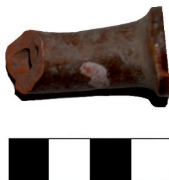
Slika 14. Lula za pušenje, smeđe ocakljena (PN 13), foto: M. Korunek-Medved

Tijekom ovih istraživanja pronađene su dvije fragmentarno sačuvane lule za pušenje. Obje su keramičke, jednostavnog oblika i bez dekoracije. Jedna od njih označena je kao PN 13 i ima na sebi smeđu ocaklinu ( slika 14 ), dok je druga neocakljena.