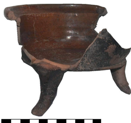
Slika 12. Posuda za zagrijavanje hrane – tronožac (PN 57), (PN 28)