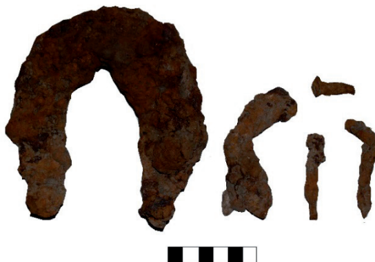
Slika 15. Metalni nalazi (potkova PN 30, ulomak potkove PN 25 i čavli PN 26)

Metalnih nalaza pronađeno je relativno malo, što iznenađuje s obzirom da se ovdje radilo o obrambenom grabištu uz gradski bedem. Pronađene su dvije cijele potkove, te jedna fragmentarno očuvana. Od ostalih metalnih nalaza pronađeni su samo željezni čavli (slika 15).