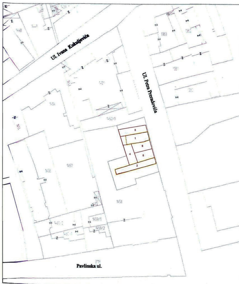
Slika 6. Raspored svih istraženih sondi (Gim d.o.o. iz Varaždina)

Tijekom svih provedenih istraživanja otvoreno je ukupno 6 sondi (slika 6) u kojima je izdvojeno 13 stratigrafskih jedinica i to: