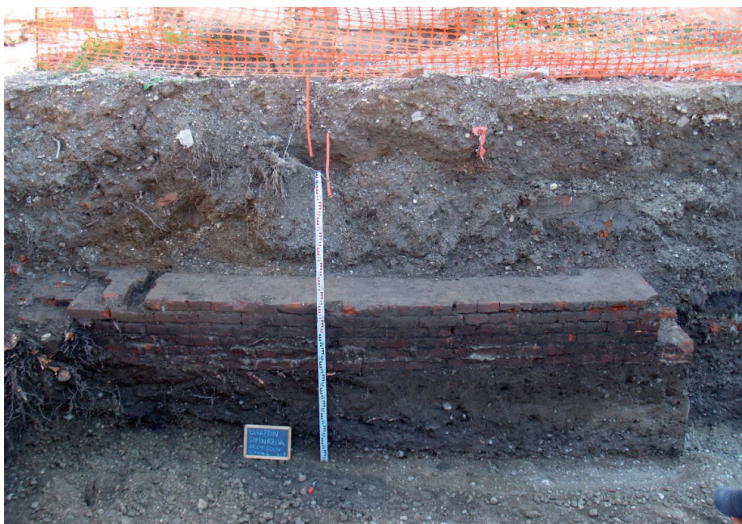
Slika 8. Zid od opeke (SJ 8)

Neposredno uz istočni ogradni zid parcele pronađen je zid od opeke, koji je označen kao SJ 8 (slika 8). Ovaj zid zidan je od 6 redova opeke, od kojih su dva donja reda ispod hodne površine (SJ 5).