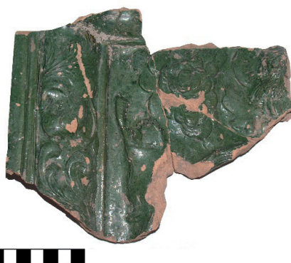
Slika 10. Pećnjak s prikazom scene Boga Oca (PN 1), ulomak, foto: M. Korunek-Medved