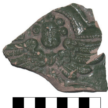
Slika 9. Pećnjak s prikazom kerubina (PN 59), ulomak, foto: M. Korunek-Medved