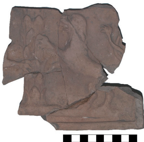
Slika 11. Pećnjak s pavlinskim grbom (PN 64), ulomak

Od životinjskih motiva najzanimljiviji je neocakljeni prikaz dva nasuprotno postavljena lava koji čuvaju palmu ( slika 11 ). Ovakvi prikazi karakteristični su za 16. i 17. stoljeće, a gotovo u pravilu se povezuju s grbom crkvenog reda Pavlina. Ovaj pećnjak također je fragmentno očuvan, ali se jasno može iščitati prikaz na prednjoj ploči. Fragment pećnjaka na kojem je prikazana ptica na vrhu palme pripada istoj sceni, ali ne može se sa sigurnošću potvrditi da se radi o istom peć-