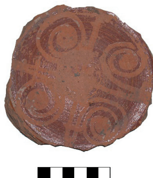
Slika 13. Tanjur, crvena ocaklina

Zanimljivi su i nalazi keramike sa slikanim ukrasom. Ukas je pretežno geometrijski, ali nalazimo i florealnu dekoraciju u vidu vitica. Najviše ima fragmenata na kojima prevladava crvena boja, dok je ukas bio bijeli, ali je propao pa ga nalazimo samo djelomično. Ovakav ukas nalazimo samo na tanjurima. Zanimljivo je u cijelosti sačuvano dno dubokog tanjura oslikano tamnocrvenom bojom sa bijelim vitičastim ukrasom od paste, koja je s vremenom otpala, a okvirno se može datirati u 16-17. stoljeće ( slika 13 ).