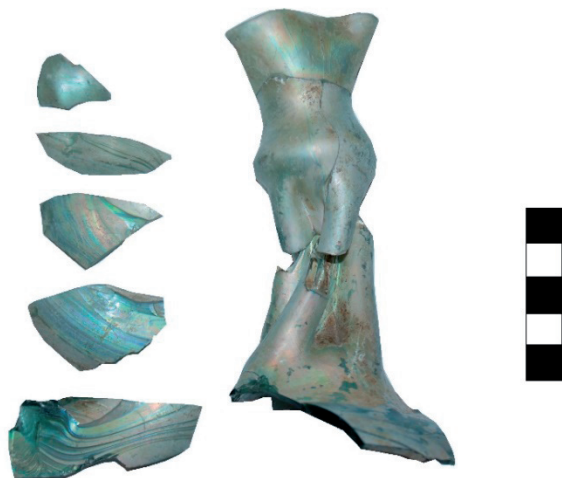
Slika 16. Ulomci kutrolfa (PN 2)

Svi pronađeni ulomci stakla pripadaju staklenim bočicama, od kojih je najveći dio imao izrazito tanke stijenke. U ovakvom tipu bočica čuvalo se nešto što je bilo izrazito vrijedno, rijetko i skupo u to vrijeme, te kao takvo nije bilo dostupno svakome. Očuvano je dosta gornjih dijelova bočica, a posebno je zanimljiv primjerak koji ima nepravilan i prema van izvučen obod, a očuvano rame bočice ukazuje da je donji dio bio izrazito trbušat.