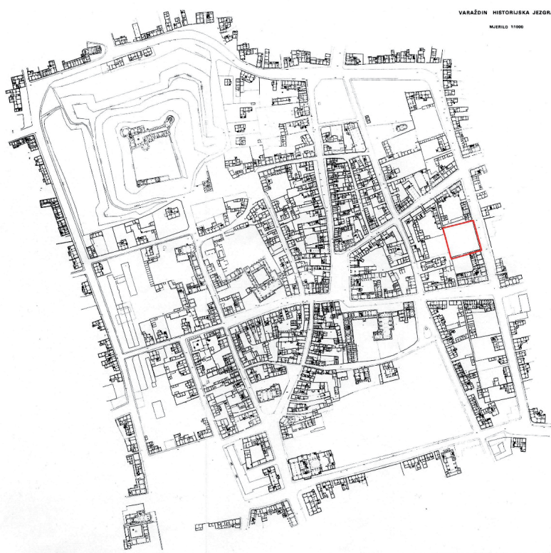
Slika 4. Snimak postojećeg stanja jezgre Varaždina 1969. godine, crvenom bojom označena je pozicija dogradnje I. gimnazije (dokumentacija KOVŽ)

Na veduti koja nastaje 80-tih godina 19. stoljeća djelomično se vidi i parcela sjeverno uz gimnaziju, na kojoj je sada planirana dogradnja I. gimnazije (slika 3). Jasno se prepoznaje istočni ogradni zid parcele, ali on je visok samo oko 1 metar. Nekoliko godina prije početka dogradnje I. gimnazije srušen je recentniji zid od opeke koji je nastao na tom mjestu, ali on je bio viši i imao je otvor na Preradovićevu ulicu. Na veduti se unutar parcele vidi drveće koje je dosta niže u odnosu na uličnu kotu.