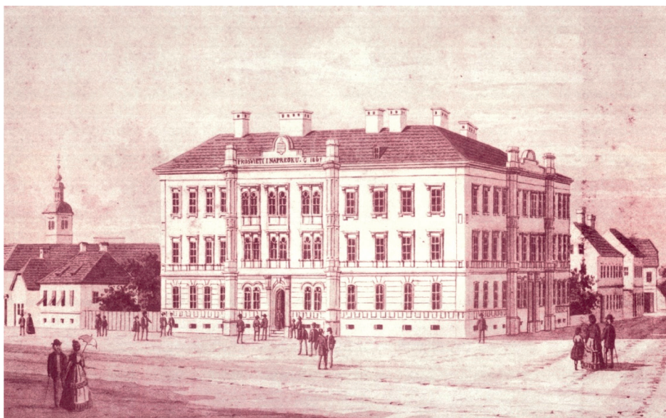
Slika 3. Veduta s prikazom I. gimnazije, 2. pol. 19. st.

Na planu grada Varaždina iz 1860. godine ( slika 2 ) vidimo da na parceli na kojoj kasnije nastaje I. gimnazija i parceli na kojoj su provedena ova arheološka istraživanja nema nikakve čvršće izgradnje, nego su one označene kao zelena površina.