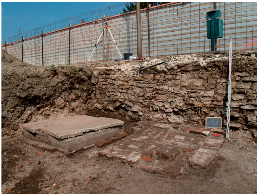
Slika 7. Pogled na bunar (SJ 2) i opločenje od opeke pronađeno uz njega (SJ 3), koji se nalaze neposredno uz istočni ogradni zid parcele kod (SJ 12)

Neposredno uz opločenje od opeke, na južnoj strani, nalazi se urušenje zida (SJ 4). U sondi 1 dužina mu iznosi 235 cm, a širina 162 cm, dok mu je visina uz kameni zid 135 cm. Urušenje je najvećim dijelom od kamena, dok samo mjestimično nailazimo na opeku. Ovakav sastav zida odgovara kamenom zidu, te se može pretpostaviti da se radi o urušnju tog zida. Naime, zid koji je nedavno srušen bio je izgrađen od opeke, što nas navodi na zaključak da je kameni zid iznad današnje razine terena bio srušen još u vrijeme kad je razina terena bila niža. Donja kota urušnja odgovara visini opločenja od opeke i gornjoj koti SJ 5.