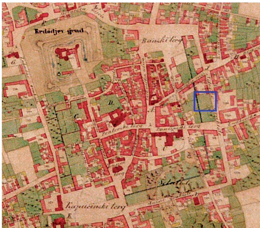
Slika 2. A. Kisweter, Plan grada Varaždina iz 1860. godine, plavom bojom označena pozicija dogradnje I. gimnazije u Varaždinu (dokumentacija KOVŽ)

Ovako započeto uništavanje gradskog obrambenog sustava nije se zaustavilo, nego je dovelo do odluke o sistematskom niveliranju grabišta 1806. godine. Plan za rušenje bedema i uređenje novonastalog prostora izrađuju županijski inženjer Ignacije Beyschlag i inženjer Josip Erdödy, te zidarski majstori Urban Greiner i Grgur Lopich. Na početku predračuna nalazi se podatak da nije isplativo vaditi temelje gradskih bedema prilikom rušenja, a da je to tako i izvedeno potvrdila su nam arheološka istraživanja na dijelovima nekadašnjeg bedema. Ovim predračunom predviđeno je i da se voda iz grabišta svede u kanal koji bi proticao sredinom grabišta, a izgradio bi se od materijala iz gradskog bedema. Na nekim dijelovima to je izvedeno već 1810. godine. 9 Iz dostupnih povijesnih podataka doznajemo da su predradnje za rušenje bedema i zatrpavanje grabišta bile opse-