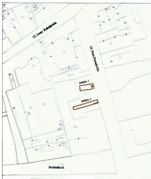
Slika 5. Položaj sonde 1 i sonde 2 (Gim d.o.o. iz Varaždina)

je bila dugačka 19,24 m, a široka 13,80 m. Preliminarnim pregledom terena prije početka radova utvrđeno je da se na istočnoj i južnoj strani čitavom širinom i dužinom parcele protežu kameni zidovi, čija je gornja zona bila vidljiva u razini zatečenog terena. Obzirom da su na početku bila planirana preliminarna arheološka istraživanja kojima bi se utvrdilo stvarno stanje terena i arheoloških struktura, prvo su otvorene dvije sonde, sonda 1 i sonda 2 (slika 5), te se temeljem dobivenih rezultata odredilo daljnje postupanje.