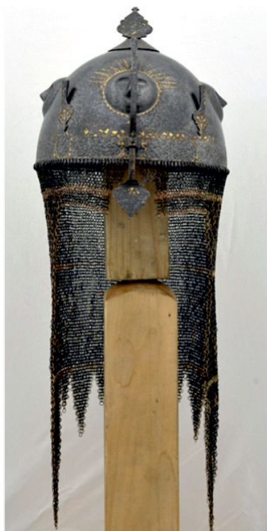
Slika 1. Kadžarska kaciga

Čelična kaciga, tzv. kolāhxud (kulah kud), izrađena za vrijeme dinastije Kadžar (1789. – 1925.), zaštićeno je kulturno dobro iz fundusa Povijesnog odjela Gradskog muzeja u Varaždinu. Kaciga je nerazjašnjene provenijencije, ali prema načinu izrade, vrsti materijala i dekorativnim elementima, činila je komplet s kružnim štitom inv. br. GMV 66636 i vjerojatno dvostrukom sjekirom inv. br. GMV 66637 iz stalnog postava Kulturnopovijesnog odjela muzeja. 2 Kacige su bile dio ukupne ratničke opreme, a oklop ratnika uz kacigu činili su prsni oklop s če-