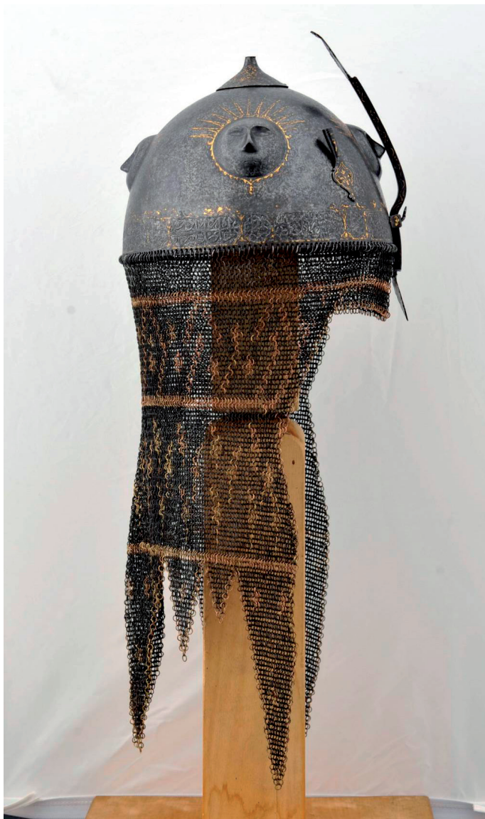
Slika 9. Kadžarska kaciga, nakon radova

du. Uz same radove na kacigi, u sklopu konzervatorsko-restauratorskih istraživanja, provedena su povijesno-umjetnička istraživanja komparativnih materijala i literature koja su rezultirala i točnijom determinacijom vremena i mjesta nastanka samog predmeta.