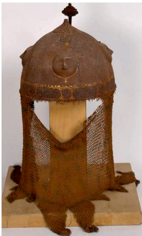
Slika 6. Kadžarska kaciga prije konzervatorsko-restauratorskih radova