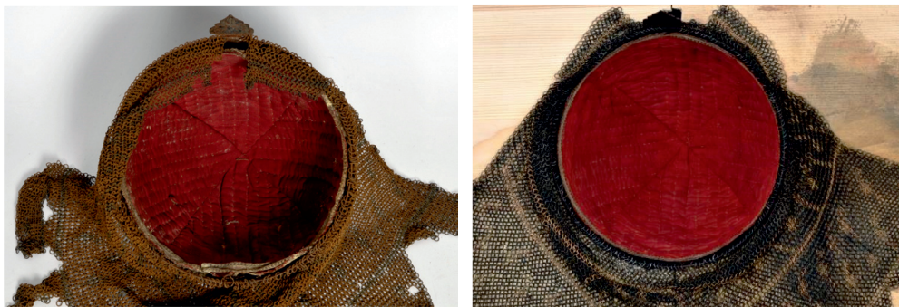
Slika 8. Unutrašnjost kacige s tekstilnom podstavom i pletivo, prije i nakon radova

Kako bi se spriječila buduća mehanička oštećenja i spriječila korozija te taloženje prašine, kacigu je potrebno pohraniti u beskiselinskoj kutiji na nosaču koji omogućuje karičnom pletivu da visi bez preklapanja i gužvanja. U kutiju se može staviti suhi silika-gel, koji na sebe absorbira vlagu. Vlažnost u čuvaonici ne bi trebala prelaziti 40%, a prilikom rukovanja kacigom, obavezno je nošenje rukavica.