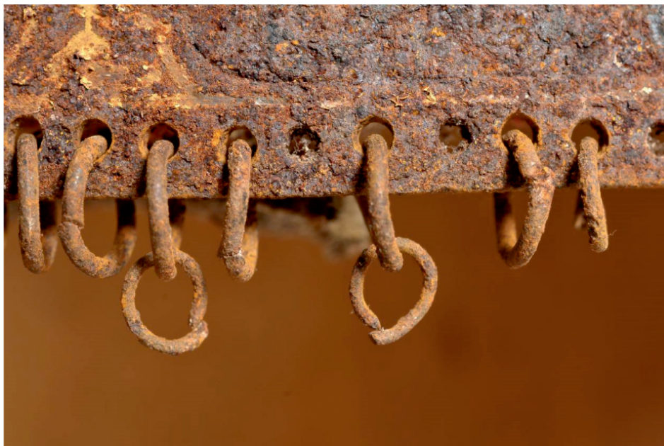
Slika 3. Obod kacige s karikama, detalj prije radova

nazivala se aragchin i nerijetko je imala nekoliko slojeva, jer je osim zaštite glave upijala i znoj ratnika. 4 Kacige su bile bogato ukrašavane ornamentom i natpisima. Dekorativnost kacige bila je gotovo jednako bitna kao i njezina namjena. Majstori koji su izrađivali ove kacige nazivali su se kolāhxudsāz , a korištene tehnike, materijali i dekorativni elementi na kacigama pokazuju iznimne sposobnosti majstora.