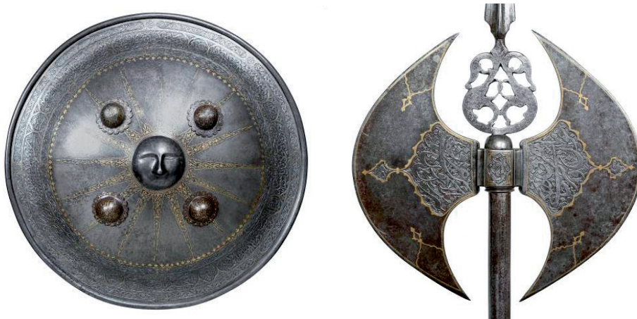
Slika 2. Kadžarski okrugli metalni štit, separ , inv. br. GMV 66636, bogato ukrašen iskucavanjem i tauširanjem u središtu sa izbočenim suncem s ljudskim licem i dvostruka sjekira, tabar , inv. br. GMV 66637

tiri ploče ( čāhrāyne ), štitnici za ruke ( bāzuband ), lančana bluza ( zirah ) te štitnici naziva jōšan i garibān . Od oružja u manuskriptima spominju se luk ( kamān ), mač ( shamšir ), buzdovan ( gorz ), sjekira ( tabar ), koplje ( neyze ), štit ( separ ), nož ( kard ) i dr. 3