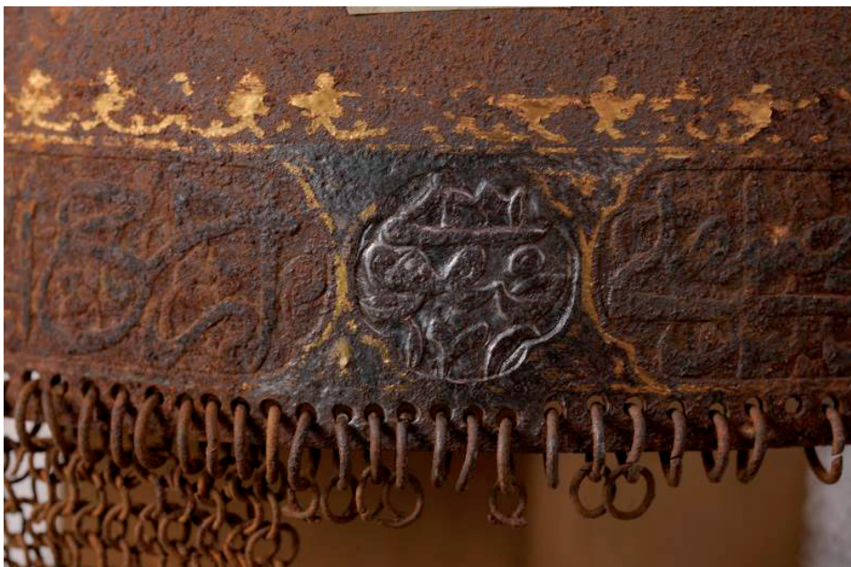
Slika 5. Obod kacige, detalj natpisa tijekom sondiranja.

davine, a pravi vrhunac i dramsku formu doživljavaju tijekom vladavine Kadžara, posebno u 19. stoljeću. Nasrudin-šah Kadžar (1831. – 1896.), umjetnosti sklon vladar, fotograf, slikar i pjesnik te prvi iranski monarh koji posjetio Europu, u Teheranu 1870. godine gradi Takia-ye Dawlat, Kraljevsko kazalište s 4000 mjesta. 18 Do zabrane šaha Reze Pahlavija, u to je kazalište bio najpoznatiji izvođač ove forme religijskog epskog kazališta.