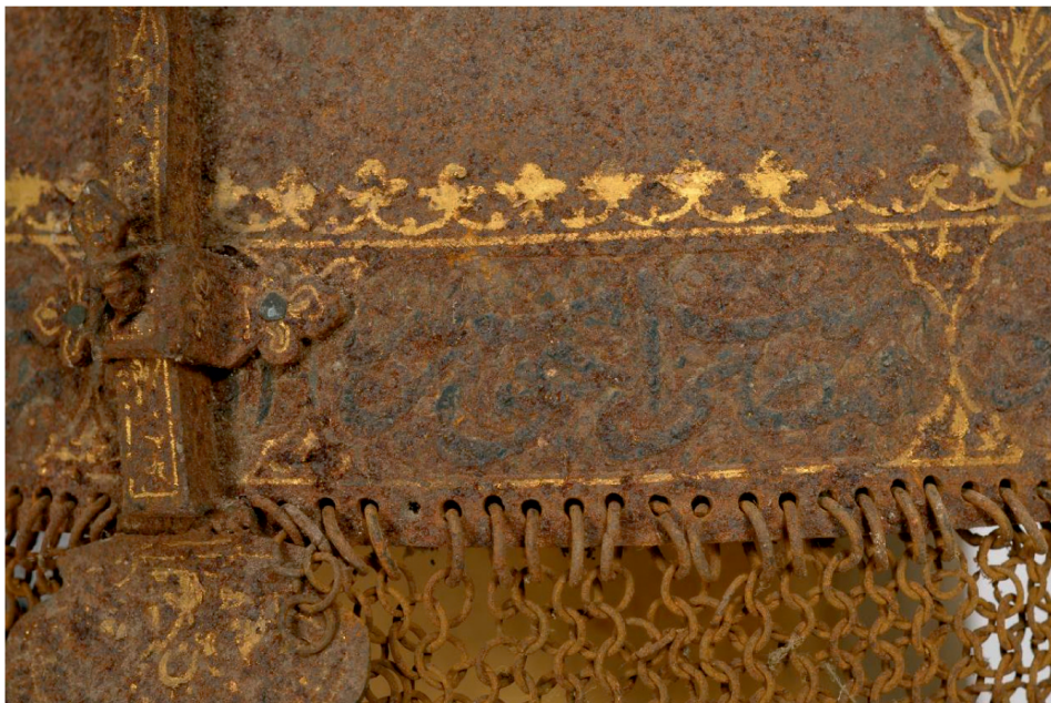
Slika 4. Obod kacige, detalj prije radova

kacigi. Koftgari tehnika bila je vrlo popularna na Istoku, a podrazumijeva umjetničku obradu na željeznim predmetima na način da se koloristički kontrastni metal umeće u udubljenja u osnovnom metalu. Postoji nekoliko različitih definicija što se koftgari tehnike tiče, ali kao osnovni metal najčešće se koristi čelik, bronca ili cinkova slitina, a umetci su najčešće od srebra, zlata ili mjedi. Površine koje se pokrivaju prvo su cizelirane, jetkane ili gravirane u željenom dizajnu, a zatim se zlato ili srebro utiskuje čekićem u utore. Površina se zatim uglađuje i na taj način se uklanja višak s površine, ostavljajući uzorak u utorima. Isti efekt može se postići blagim zagrijavanjem predmeta kako bi se metali sjedinili, a zatim bi se nakon hlađenja tauširani dio strugao, turpijao ili polirao. Prema analizi Feuerbach, postoje tri tipa koftgari tehnike i to plitki koftgari, lisnati koftgari i mrežasti koftgari. Na obodu kacige je primijenjen plitki koftgari. 7