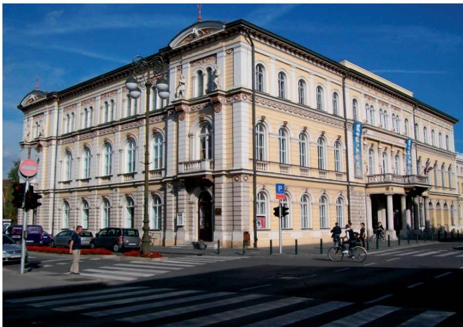
Slika 5. Zgrada HNK – jugozapadna strana s ulazom u Knjižnicu

Bilo je potrebno najprije cijelu, doista veliku, građu sistematizirati i pretvoriti u statističke podatke i prikazati tablično radi lakše analize i dokumentiranja. Tako je nastala skupna tablica čiji karakterističan uzorak (izvadak) prikazujemo: 10