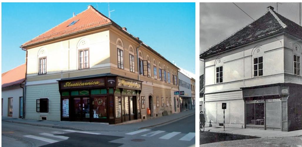
Slika 1. Zgrada nekadašnje knjižare Granap (lijevo, današnji izgled); desno, stariji izgled zgrade.

1. Godine 1948. „Varaždinske vijesti“ obaviještavaju: „U utorak, 6. srpnja 1948. navršit će se 110 godina, što se je u Varaždinu, u nekadanjoj Biškupečkoj ulici broj 10 rodio čuveni naučenjak - slavista Vatroslav Jagić. Narodna čitaonica i knjižnica ... Sloboda uredit će 5. srpnja 1948. poseban izlog u knjižari „ Granap “ (Šenoina ulica broj 6 — nasuprot hotela „Istre“) u kojem će biti izložena naučna djela i razne fotografije iz života Jagićeva, na što već sada upozorujemo naše građanstvo.“ 4