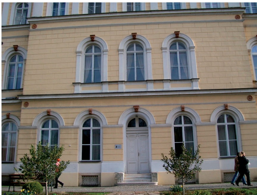
Slika 2. Sjeverna strana kazališne zgrade - stari ulaz u Knjižnicu