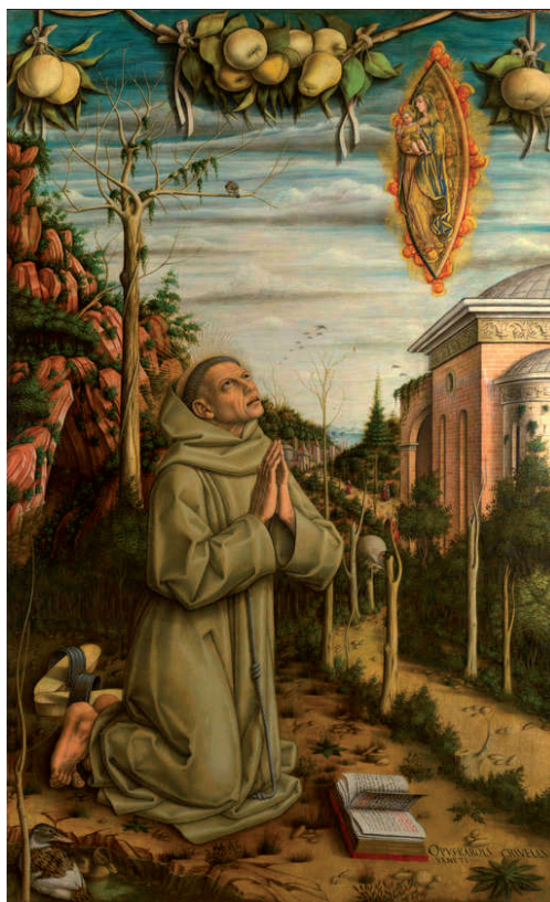
Slika 2. Il Beato Gabriele Ferretti in estasi , prikazan u ambijentu vrtova konventa Sv. Franje ad Alto u Anconi, 1485./1489. Carlo Crivelli, National Gallery, London. 21