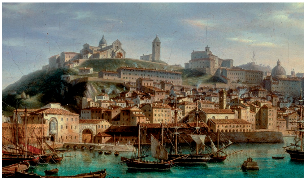
Slika 5. Veduta luke Ancona, detalj; Barnaba Mariotti, 1850. Pinacoteca civica F. Podesti, Ancona. 103

Slijedi zapis na talijanskome jeziku, kojim se navodi da je Girolamo Thomasi , 101 konzul (!), 102 najsvjetlije vlasti Dubrovnika i njezinih sudita u (ovome) gradu Anconi te se iskazuje potpuno i nesumnjivo povjerenje – u odnosu na sve i konkretne osobe do kojih će dospjeti navedeno pismeno – da je prethodno spomenuti gospodin Francesco Spinello, zamoljen da zapiše gore izloženo, javni i zakoniti ankonitanski notar dostojan vjere i da se njegovim javnim spisima daje široko pouzdanje u prosuđivanju na svakome mjestu. To je u znak vjere u Anconi izdao kancelar Ambrosius Thomasius dana 18. prosinca 1589. godine, a u znak vjerodostojnosti isto je, kako pokazuje prijepis, bilo opravosnaženo pečatom sv. Vlaha. Kancelar je pripadao istoj obitelji kao i dubrovački konzul u Anconi.