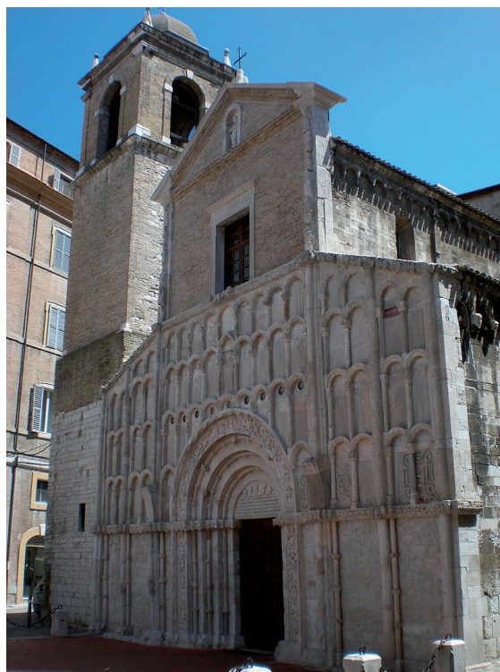
Slika 4. Santa Maria della Piazza, XI. – XII. st., pročelje. 77