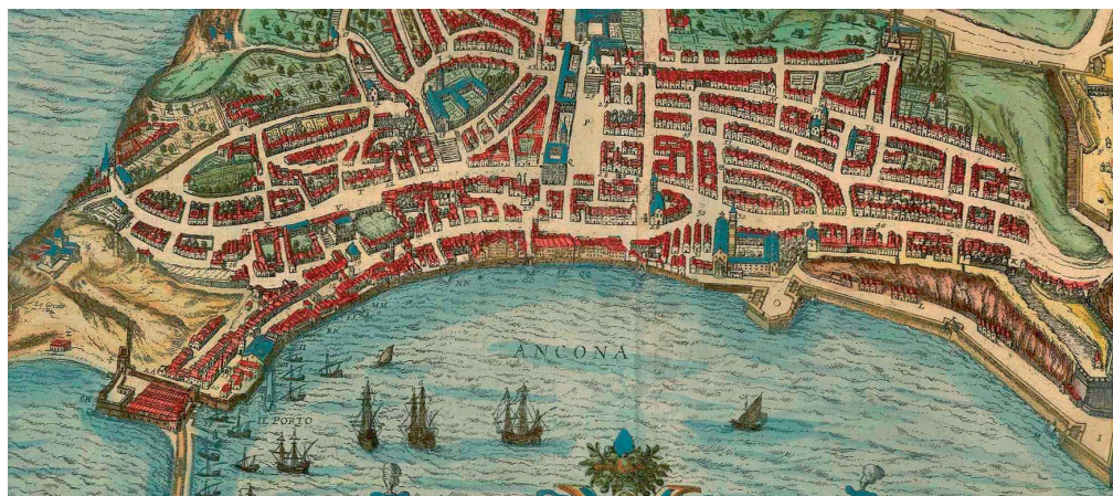
Slika 1. Ancona civitas Piceni celeberrima, ad mare Hadriaticum posita , detalj plana Brauna i Hogenberga iz 1593. godine (prvo izdanje: 1572.). 8 Brojem 21 (u blizini lučkih skladišta) označena je crkva Sv. Primiana, a slovom P la Piazza del mercato.