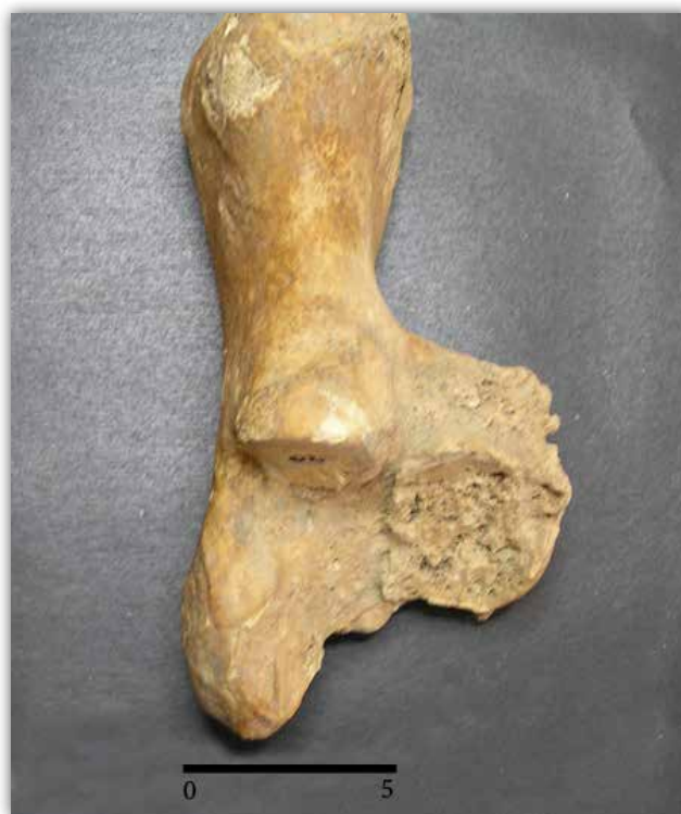
Slika 4. Patološke promjene na desnom calcaneusu konja G1_02 s konjskog groblja Goričan