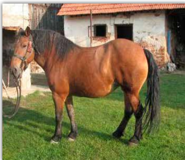
Slika 2. Međimurska kobila Suzi; 12 godina (preuzeto iz: Kostelić i sur., 2009.)

vedeni autori zaključuju da se međimurski i posavski konj znatno razlikuju u visini grebena, visini leđa, visini križa, visini korijena repa, dužini leđa, širini sapi, dužini lica, dužini uha i dužini sapi. Međimurski konj i hrvatski hladnokrvnjak znatno se razlikuju u širini prsa, dužini i širini glave, širini sapi i dužini lica. Ivanković (2004.) opisuje međimurskog konja kao krupnog i snažnog s dobro razvijenim mišićjem, relativno male glave te kratkog, mišićavog i nisko nasadehog vrata. Visina umjereno izraženog grebena kreće se od 145 do 165 cm, prsa su duboka, trup širok i zbijen, a noge snažne, čvrste, pravilnog stava sa širokim i nešto strmijim kopitima. Najčešće boje tijela su boja tamnog dorata, dorata, vrana, alata i siva (slika 2). Čačić (2011.) međimurskog konja također opisuje kao životinju male glave, kratkog vrata, širokih i relativno kratkih leđa te širokih i rascijepljenih sapi. Poželjna visina grebena kreće se od 155 do 165 cm, pastusi su težine 800 – 900 kg, a kobile 650 – 800 kg. Najčešće se pojavljuje kao dorat, zatim alat i vranac, a rjeđe u svojoj boji.