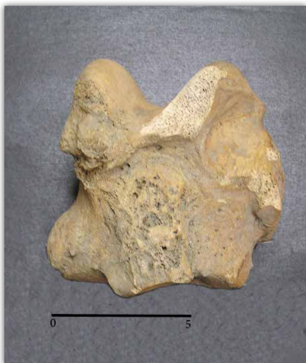
Slika 3. Patološke promjene na desnom talusu konja G1_02 s konjskog groblja Goričan