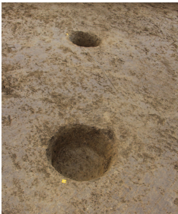
Sl. 2 Ukopi stupova SJ 5 i SJ 7 na istočnome dijelu nalazišta

Fig. 1 A view on the western part of the site looking from the south