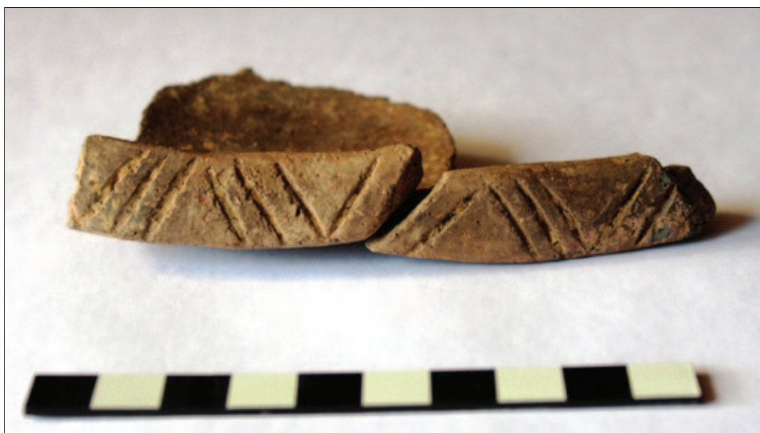
Sl. 25 Ulomci keramičkih posuda vinkovačke kulture Fig. 25 Fragments of ceramic vessels of the Vinkovci culture

U istraživanjima su prikupljene 272 vrećice uzoraka. Uglavnom je riječ o ljudskim kostima iz grobova i slojeva te o ponekoj životinjskoj kosti ili zubu, komadima žbuke i ugljena te uzorcima tkanine, troske, zemlje i sl. Odabrani nalazi bit će poslani na daljnje analize, osobito osteološki materijali iz grobova. Tako ćemo doznati više o načinu života novljanskoga stanovništva tijekom kasnoga srednjeg i ranoga novog vijeka.