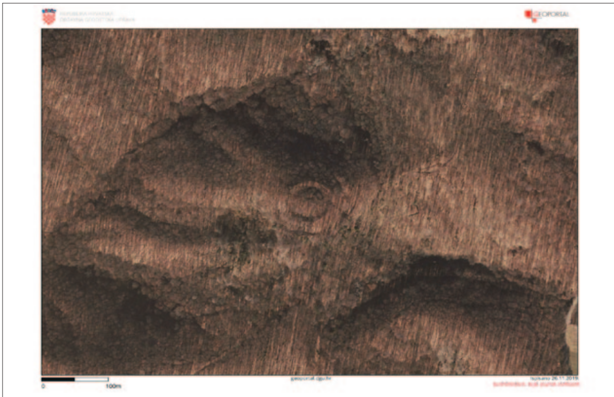
Sl. 30 Visinska utvrda Gradina iznad Voćarice i Paklenice na aerofotogrametrijskoj snimci

Fig. 30 Aerial photogrammetric image of the Gradina hill fort above Voćarica and Paklenica