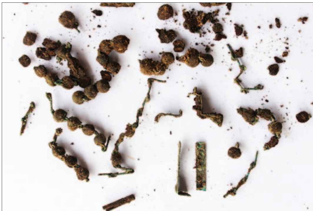
Sl. 23 Ostaci drvene krunice i križa (PN 58) iz groba 60, stanje prije čišćenja

Od posebnih nalaza iz grobova svakako još valja istaknuti i vrlo dobro očuvan srebrni bečki pfenig pronađen u grobu 12 (PN 7). Kovan je od zatamnjenoga srebra, otišnut samo s prednje strane na kojoj se već i prije čišćenja vidi trolis izvan kojega se vide tri šesterokrake zvijezde, a unutar se u sredini nazire štitasti grb (vjerojatno grb Austrije, jako izlizan) i uokolo njega inicijali AL, B, t. Čini se da je riječ o novcu Alberta II. Habsburgovca koji je od 1437. do 1439. bio ugarsko-hrvatski kralj kao prvi od mnogih pripadnika dinastije Habsburg (od 1404. do 1439. kao Albert V. bio je austrijski nadvojvoda). U grobu 30 nađena su slijepljena četiri komada srebrnih sitnih novaca – moguće različitih vrijednosti (PN 12), no čini se da je riječ o novcima kralja Žigmunda Luksemburškog (1387. – 1437.). Na jedinom vidljivom aversu nalazi se