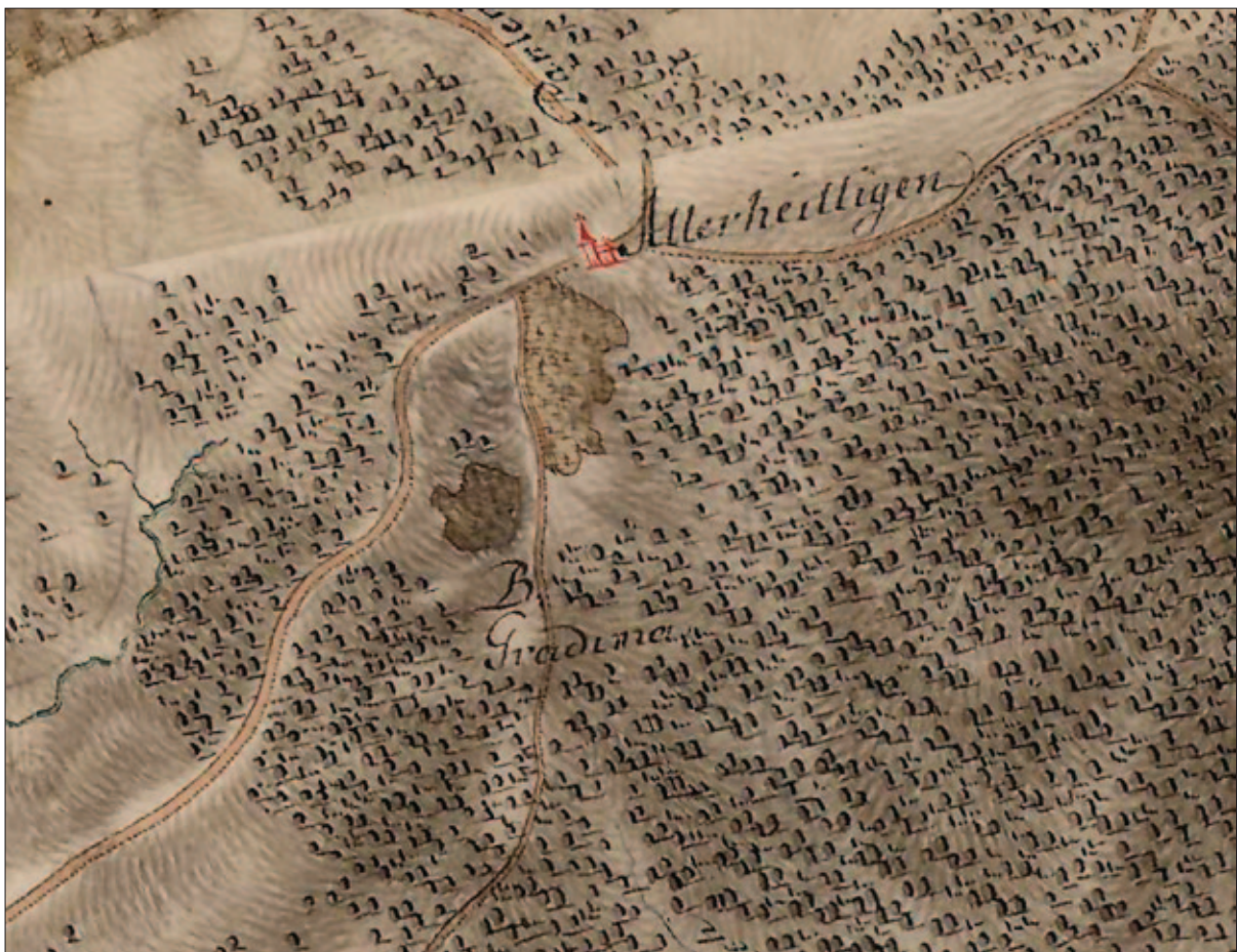
Sl. 31 Crkva sv. Svetih i Gradina iznad Voćarice i Paklenice na habsburškoj karti prve vojne izmjere iz 1780. god. (MAPIRE)

Fig. 30 Aerial photogrammetric image of the Gradina hill fort above Voćarica and Paklenica (SGA Geoportal)