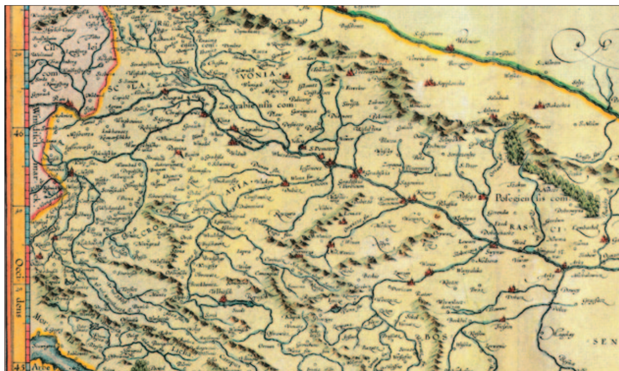
Sl. 2 Karta Scлавonia, Croatia, Bosnia cum Dalmatiae parte Gerardusa Mercatora, Amsterdam, 1623. (Kozličić 2018: 89, 90, K-13); isječak

Ostaje pitanje može li postojeći toponim Bjelavina – koji doista može biti prežetak 1334. godine zapisanog toponima Belina – pomoći u ubikaciji? Problem je što je to čest toponim pa ga tako na habsburškim kartama nalazimo, primjerice, i uz Kraljevu Veliku ( Bielavina ) (treća vojna izmjera 1869. – 1877.) ili u brdima iznad Voćarice i