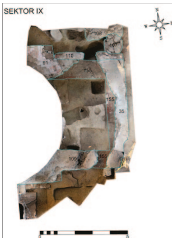
Sl. 6 Sektor IX, tlocrt s ucrtanim ostacima arhitekture (izradio: M. Babeli; 3D model u podlozi izradila: V. Gligora)