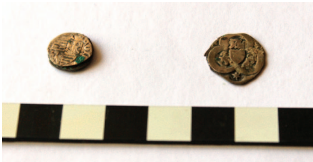
Sl. 24 Novci Žigmunda Luksemburškog iz groba 30 (PN 12; desno) te Alberta II. Habsburgovca iz groba 12 (PN 7; lijevo) Fig. 24 Coins of Sigismund of Luxembourg from grave 30 (SF 12; on the right) and Albert II of Habsburg from grave 12 (SF 7; on the left)

savršeno sačuvan čavao (PN 88), a u sloju sa spaljenim kostima (SJ 261) čavao (PN 91) s rastaljenom i savijenom glavom, možda kao posljedica gorenja. Oba čavla nisu nimalo korodirana. Najzanimljiviji nalaz iz sektora III svakako je čašasti pećnjak smeđe boje pronađen u sloju urušenja (SJ 245). Manjih je dimenzija, grublje izrade, s ravnim dnom i stijenkama nakošenim prema van. Takav tip pećnjaka datira se širokim vremenskim rasponom, od 14. pa sve do 17. stoljeća (Radić, Bojčić 2004: 231–233).