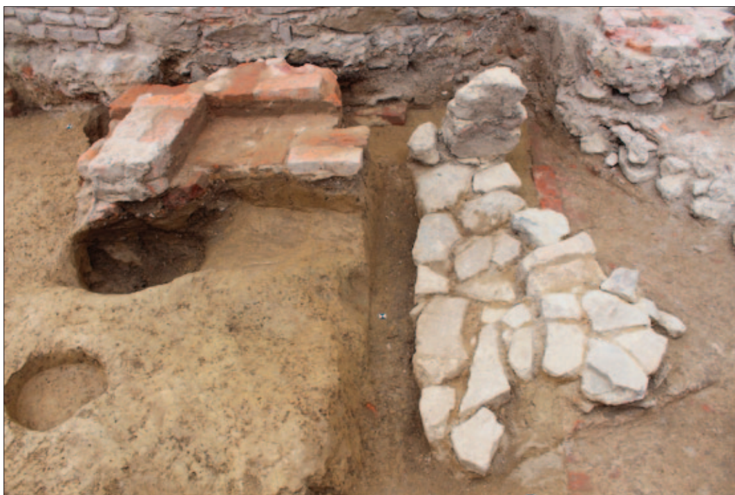
Sl. 8 Novovjekovne grobne strukture SJ 116 i 39, pogled s istoka Fig. 8 Modern Age grave structures SU 116 and 39 seen from the east