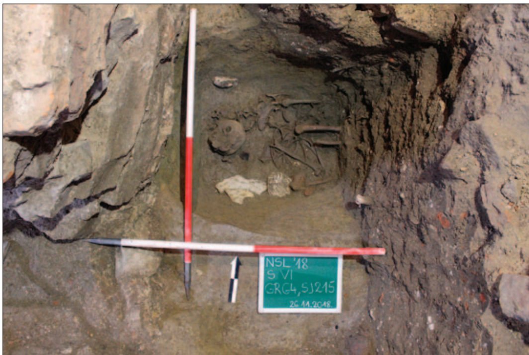
Sl. 17 Grob 64