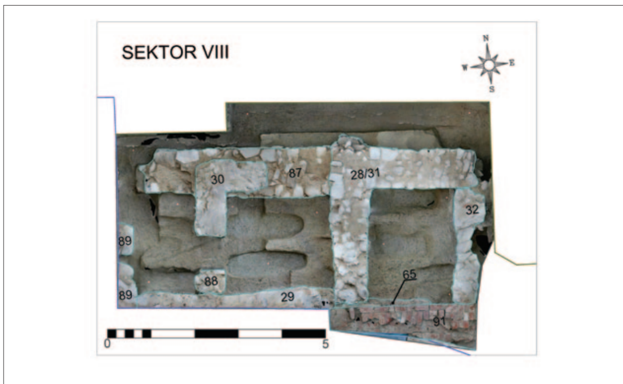
Sl. 3 Sektor VIII, tlocrt s ucrtanim ostacima arhitekture (izradio: M. Babeli; 3D model u podlozi izradila: V. Gligora)

Temelj/zid SJ 91 ostatak je sjevernoga zida broda crkve iz kasnoga srednjeg vijeka, a njegov je nastavak pronađen unutar crkve u sektoru VI gdje je dobio oznaku SJ 283. Na SJ 91 prilijepljen je temelj SJ 31 građen od većega nepravilnog bijelog i sivog kamenja koji se pruža prema sjeveru. Na jednak način bio je zidan i temelj SJ 28 koji se pruža u smjeru istok – zapad na oko 2,5 m udaljenosti od zida crkve, a građen je istovremeno s temeljom SJ 31 s kojim čini jednu cjelinu. Pogledamo li tlocrt, zajedno s ova dva temelja treći temelj, SJ 32, zatvara jednu logičnu pravokutnu prostoriju sjeverno uz crkvu. No, taj potonji temelj je od njih značajno plići! Zidan je