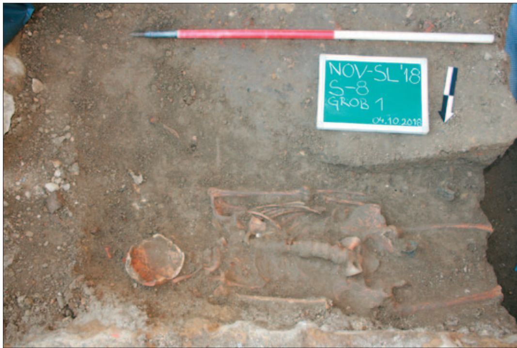
Sl. 5 Grob 1 sa zvonom (PN 1) in situ