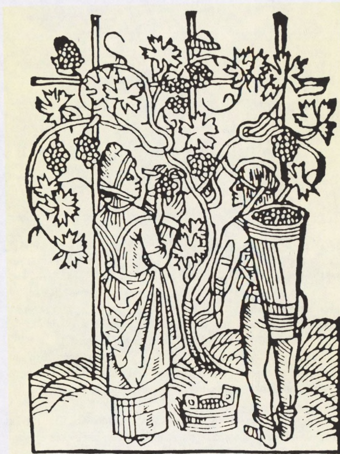
Iz knjige "Martinje", Zagreb 1992. godine

Zemljište se moralo najprije duboko prekopati - u dubinu do lakta ili koljena - da bi se sadnice mogle dovoljno duboko položiti u zemlju. 6 U sađenje vinove loze i uzgoj mladog vinograda trebalo je uložiti dosta rada - postavljanje kolja, uklanjanje korova, jesensko zgrtavanje čokota, proljetno odgrtanje itd. 7 Vinova loza se u srednjem vijeku obrezivala na dva načina: ona se ili nisko obrezivala u proljeće tako da se nije puštalo jako razvijanje mladica ili se puštalo da mladice izrastu pa su se tek onda obrezivale. Prvi način je bio češći. Posao oko zasađenih vinograda bio je nešto lakši. Vinograd se okopavao, čistio i obrezivao, a kopalo se obično motikom. 8