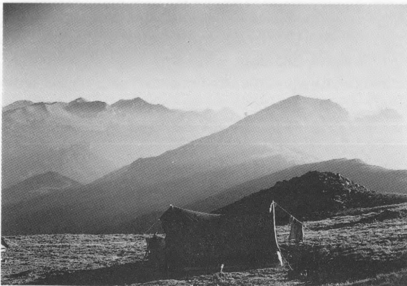
Noćivanje pod zvijezdama na 2600 m visine pod Crnim vrhom na Šar-planini bilo bi u mom sjećanju nepotpuno kao doživljaj bez ovako uhvaćenog pejzaža dana na izmaku