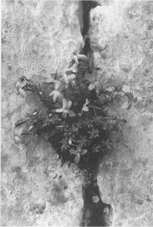
Slika podržava sjećanje na ovaj predivan susret s ljepotom i rijetkošću prirode. Ljubica s planine Jakupice u Makedoniji /Viola Košaninii/