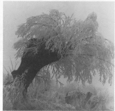
Vrba je nerazdvojna od pejzaža podravske ravnice. Ali ovaj trenutak uhvaćen usred zime negdje oko Đelekovca svjedoči na poseban način o tako jednostavnim i lijepim sadržajima oko nas