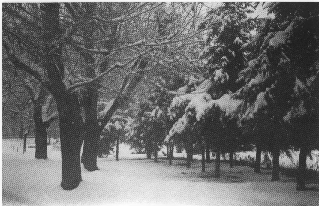
Koprivnica, šetalište, uz paviljon (zapadno)

Najnovijim uređenjem parka "Projektne organizacije Zrinjevac" iz Zagreba učinjeni su obimni zahvati. Park je temeljito očišćen i prorijeđen sječom samoniklog grmlja i drveća. Uklonjene su stare, suhe i bolesne grane, a gdje je bilo potrebno i cijelo drvo. Na nekim mjestima zasađene su nove vrste mladih i plemenitih biljaka, a uklonjena stabla zamijeniti će se novim sadnicama. Staze su obnovljene slojem novog šljunka, a u dogledno vrijeme očekuje se i gusto zasađena trava pogodna za šetnju i odmor. Međutim, nekim se zahvatima prilično udaljilo od izvorne autentičnosti parka. Šetnice su omeđene niskim rubnicima, a mjestimice su i proširene pravokutnim plohama prostorima za klupe. Najveća pogreška učinjena je na šetalištu trostrukog drvoreda gdje je put širine 13 m sužen na širinu od 3,60 m i zbijen između dva reda stabala. Tip klupe s metalnim viticama odgovara parku iz 19. st. Smeta jedino njihov preveliki broj, te šarenilo metalnih dijelova - obojeni su bijelom, crnom i oker bojom. U središnjem dijelu uz paviljon postavljeni su kandelabri. Iako rađeni po uzoru na prošlostoljetne svjetiljke, forma ne slijedi originalne proporcije pa djeluju nezgrapno i zdepasto. Uostalom, krajem 19. st. park su osvjetljavali trostruki kandelabri. Nerazumljivo je zašto su se projektanti izabrali stilske spojive klupe i svjetiljke, odlučili za suvremeno dizajnirane kante za smeće. Njihov moderan oblik odgovara uličnim gradskim prostorima ali je potpuno neuklopiv u postojećem parkovni inventar.