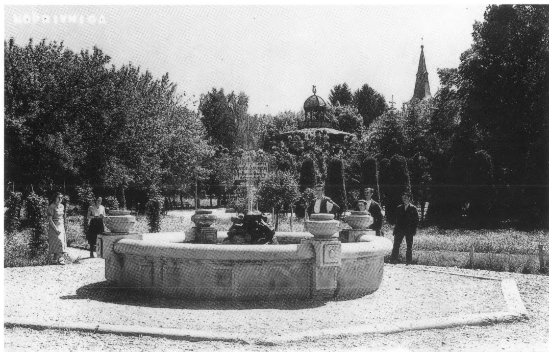
Gradski park, vodoskop

Današnja slika parka prilično se razlikuje od prvobitnog izgleda. Obilježja francuskog parka, tj. veliki perspektivni efekti i vizure, te simetrične plohe šišanjem oblikovanih stabala postepeno nestaju. Park naglašenog arhitektonskog izraza izrastao je u park šumu. Travnjaci su mjestimično zasađeni novim stablima, a visina drveća zaklanja pogled na crkvene tornjeve. Odustajanjem od šišanja drveća izgubljen je i dvostruki red čempresa - "Aleja uzdisaja" koja se toliko proširila i razgranala da je morala biti posječena. Izmijenjena je i vegetacija po vrstama. Iz parka je nestalo raskošno stablo palme i divlje datule, a cvjetni nasadi penjačica visine metar do metar i pol, zamjenjeni su niskim pokrovnim biljem (kao npr. na trokutnom polju s južne strane paviljona). Zanemarena su i dva alpiniuma - niska zemljana humka obložena kamenjem i zasađena cvijećem. Nema više ni kaktusa u dekorativnim posudama na ogradi fontane, a nestalo je i lišće lopoča i trske, baš kao i praćakanja zlatnih ribica iz vode bazena. Visok i širok mlaz vodoskoka zamijenjen je s više tankih i niskih mlazića koji lučno padaju u vodu.