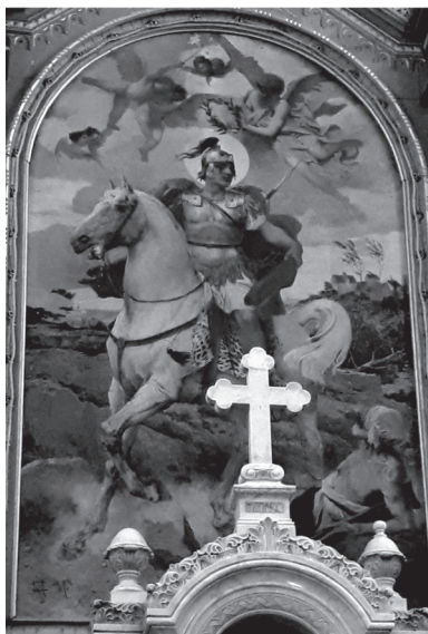
Sl. 7. Vincent iz Kastva, Sv. Martin i prosjak , 1474., sjeverni zid crkvice sv. Marije na Škrilinah

kojemu su razigrani anđeli od kojih jedan stavlja lovorov vijenac na svečevu glavu.