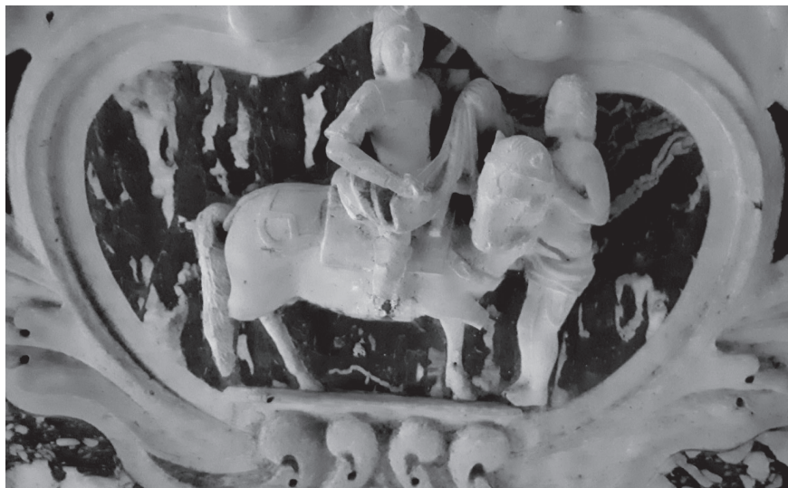
Sl. 5. Sv. Martin i prosjak , 18. st., ukrasni medaljon baroknoga oltara iza glavnoga oltara, župna crkva sv. Martina u Bermu

Nešto niže, na prednjoj strani barokna oltara ukrašena bijelim vitičastim biljnim ornamentima, u središtu ukrasnoga medaljona je ista scena Martinova milosrđa.