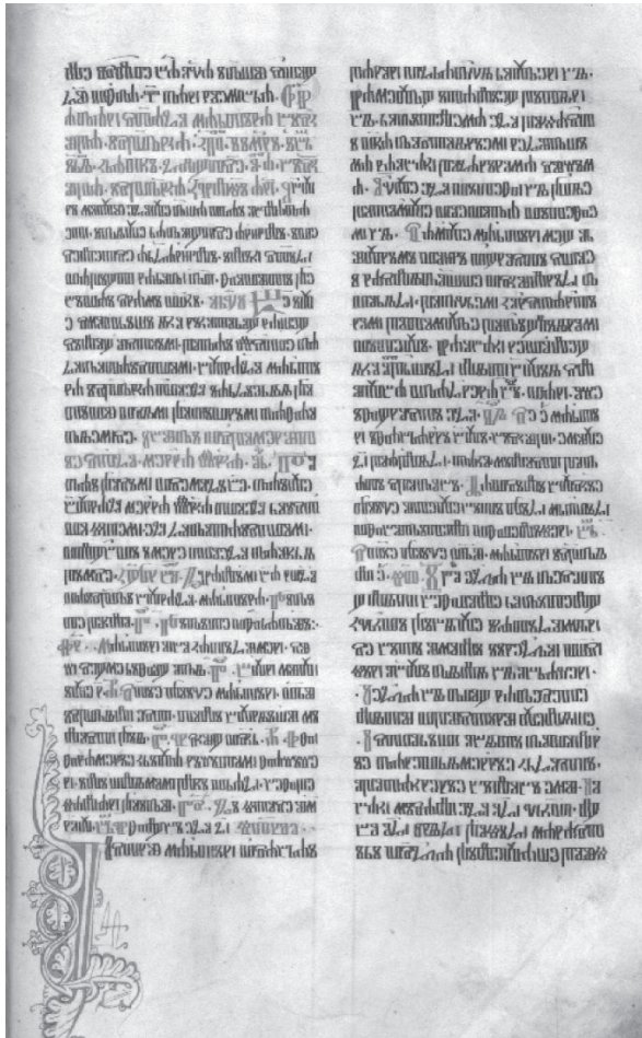
Sl. 1. Početak čitanja sv. Martina iz Prvog beramskog brevijara (Ms 161, fol. 151a)