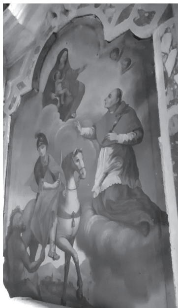
Sl. 4. Sv. Martin i prosjak , 18. st., nepoznati autor, oltarna pala baroknog oltara iza glavnoga oltara, župna crkva sv. Martina u Bermu