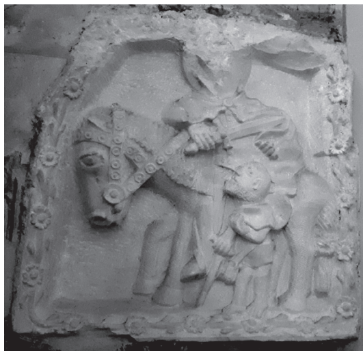
Sl. 6. Sv. Martin i prosjak, nepoznati autor, kasnogotički kameni rustikalni reljef, desno od glavnoga oltara, župna crkva sv. Martina u Bermu

snije srednjovjekovnog viteza Martina, u dobričinu na sustalom seljačkom kljusetu kraj punoglava ubogara koji će se odmoriti na pragu prve seljačke kuće» (EKL 1960: 156).