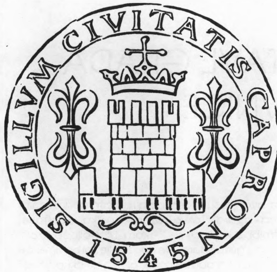
Prvi poznati oblik grba grada Koprivnice s isprave gradskog suca Čmahora iz 1545. godine