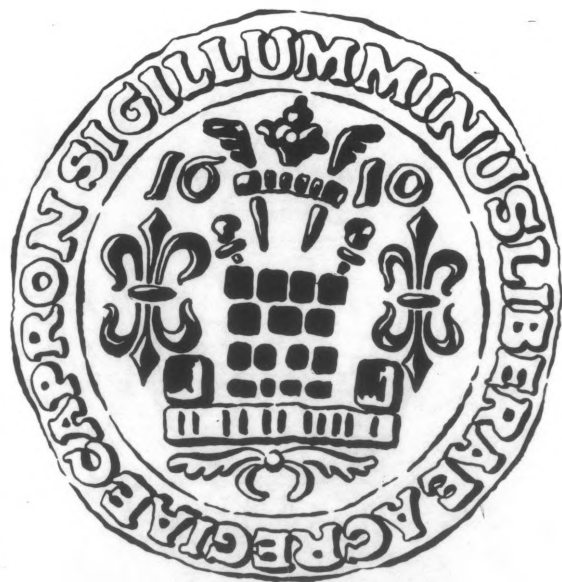
Grb grada Koprivnice na pečatu jedne isprave iz 1610. godine; dugo vremena je smatran najstarijim poznatim grbom (crtež izradio Josip Gregurić 1992.)

Nalazimo ga na cehovskim ispravama raznih koprivničkih cehova, na zgradi današnje koprivničke vijećnice (Zrinski trg),