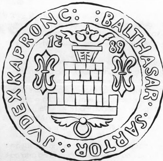
Grb grada Koprivnice iz 1589. godine

disciplina, počela obavezno izučavati i na sveučilištima.