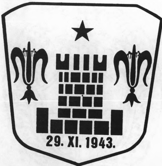
Službeni grb grada Koprivnice nakon završetka II. svjetskog rata do 1991. godine

a jedan primjerak, izrađen u drvu, čuva Muzej grada Koprivnice 13 . Taj grb je korišten, kao službeni, sve do raspada Austro-Ugarske monarhije 1918. godine. Nalazimo ga na općinskim biljezima, za vrijeme kraljevine SHS, od 1929. Kraljevine Jugoslavije, s minimalnom izmjenom oblika kraljevske krune. Isti biljezi su korišteni i za jedno vrijeme NDH, 1941.-1945. godine, s pretiskom vrijednosti u novčanoj jedinici kune 14 u apoenima jedne i stotinu kuna.