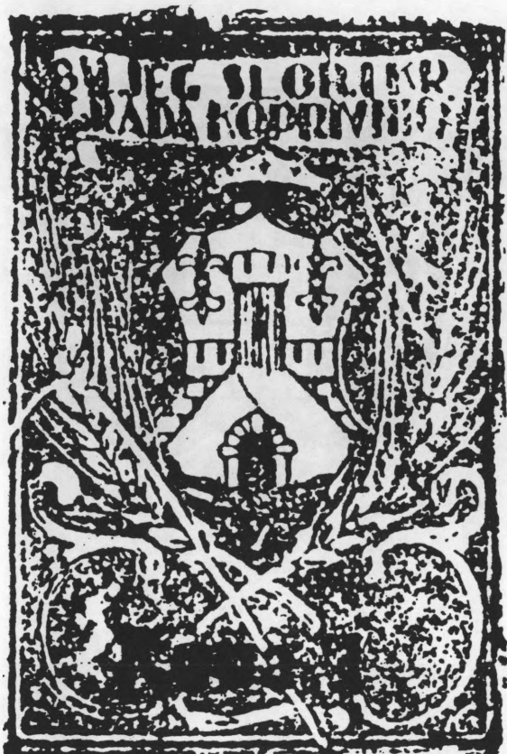
Općinski biljeg slobodnog i kraljevskog grada Koprivnice sa slikom grba, korišteni do 1946. godine