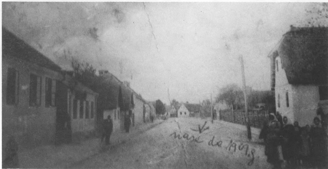
Detalj iz glavne ulice u Ludbregu krajem 19. stoljeća