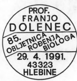
Prigodni poštanski žigovi Filatelističkog društva Virje