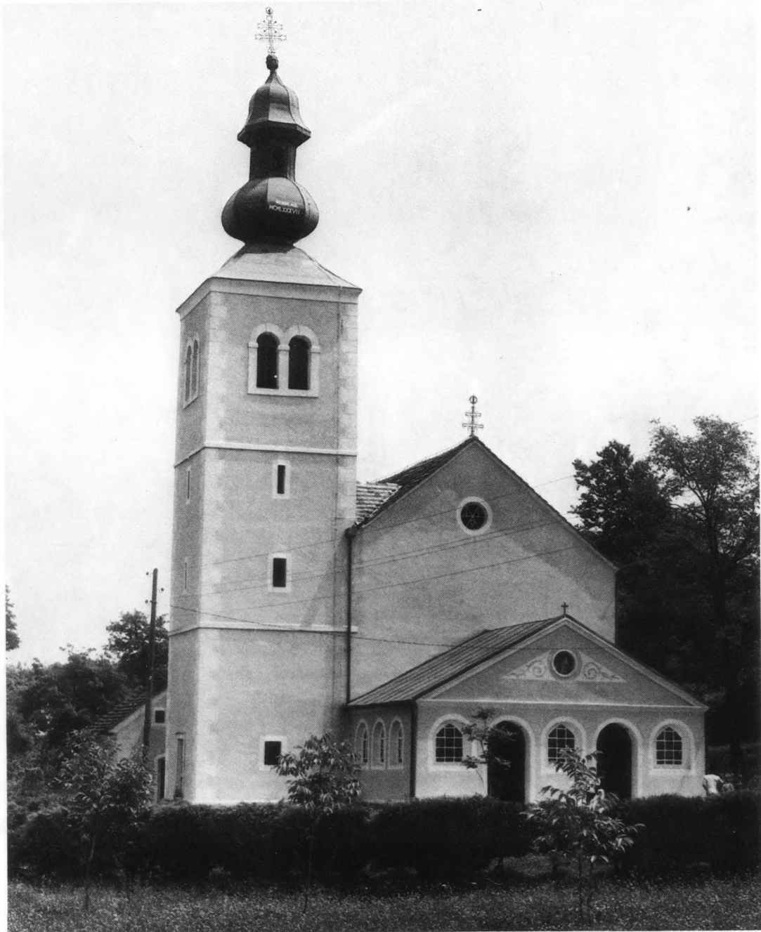
Zavjetna crkva Blažene Djevice Marije u Močilama