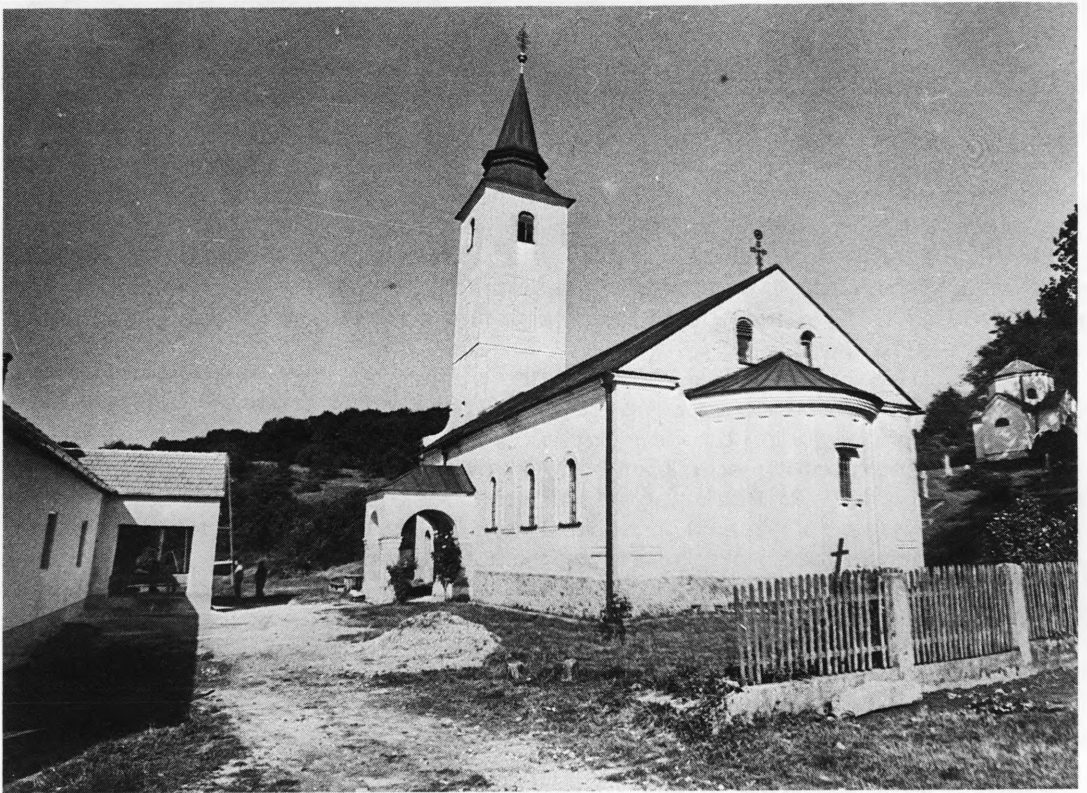
Manastirski kompleks u Lepavini

Naseljavajući se na ovo područje, Srbi donose pravoslavlje te grade pravoslavne crkve. Uskoro po formiranju prvih srpskih naselja u ovom kraju, oko 1550. godine podignut je manastir Lepavina, duhovni centar ovdašnjih Srba koji je kroz četiri stoljeća svog postojanja odigrao veliku ulogu u održanju njihovog vjerskog i nacionalnog identiteta. Manastir Lepavina prošao je burnu povijest. Tako su već 1557. g. manastir spalili Turci.