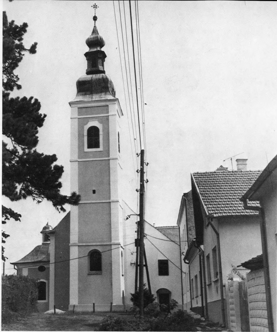
Franjevačka crkva i samostan u Koprivnici

boravka u Koprivnici. To je jedini muški rimokatolički red koji se na koprivničkom području održao do danas.