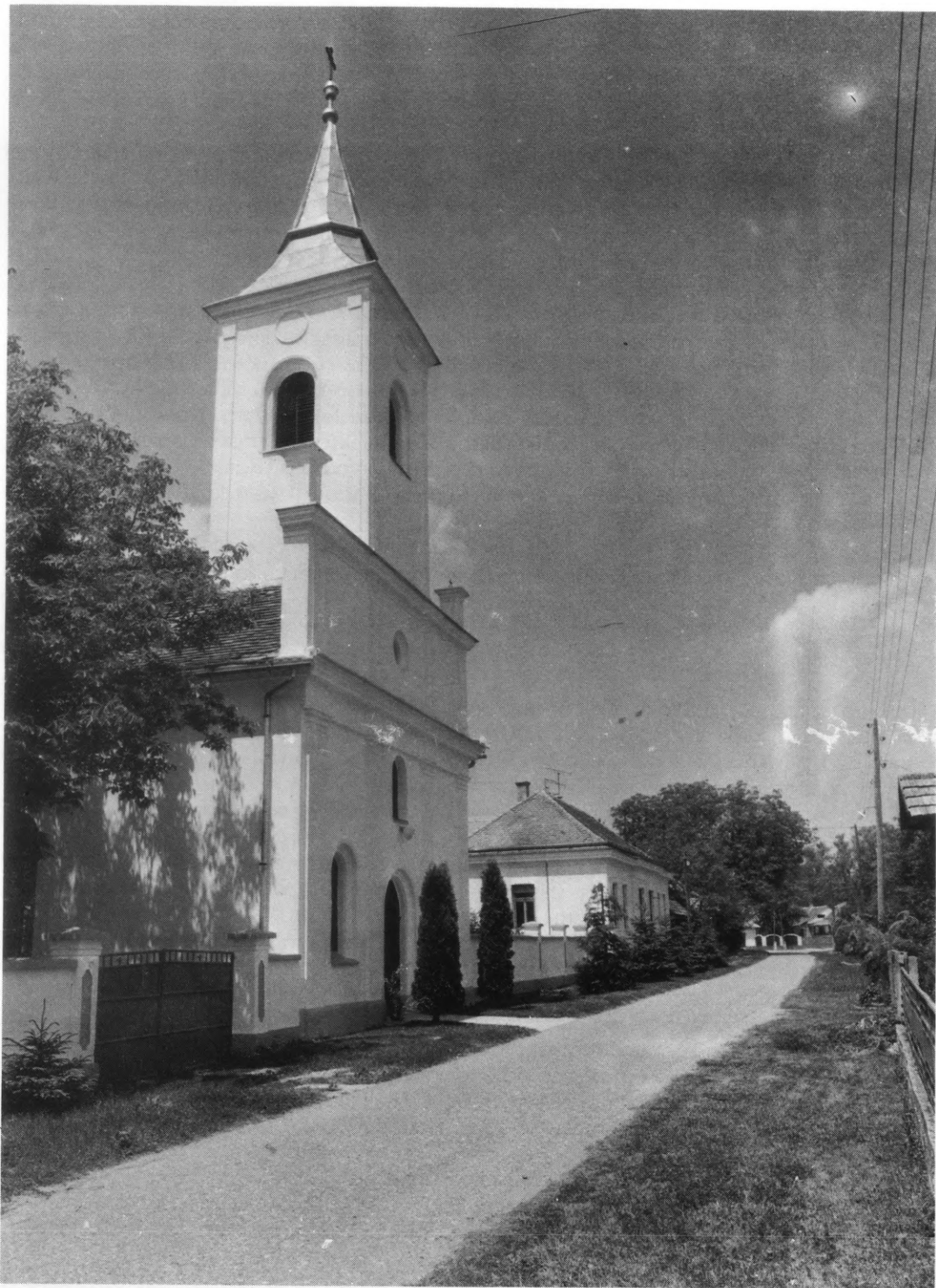
Evangelistička crkva u Legradu