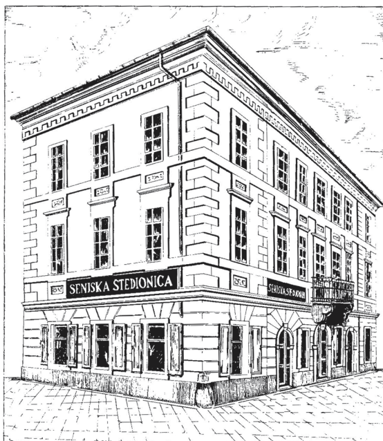
Sl. 1. Zgrada Senjske štedionice Senj u Jurišićevoj ulici br. 62 93

dobitak štedionice iznosio je 22.608,03 dinara. 89 Od ukupno 25.489,08 dinara režijskih troškova u 1938. godini za milodare je utrošeno 930 dinara. 90 Vrijednost vlastitih nekretnina iznosila je 470.000 dinara, od toga 1. dvokatnica u gradu Senju, Jurišićeva ulica br. 62 (260.000 dinara) s namještajem (30.000 dinara), 2. trokatnica u gradu Senju, Paskvićeva ulica br. 160 (150.000 dinara) s namještajem (25.000 dinara), 3. zemljište "Novi Svit" u gradu Senju na morskoj obali (5.000 dinara). 91 Prihod vlastitih nekretnina (najamni brutto dohodak) iznosio je 28.385 dinara, od toga: za kuću u Jurišićevoj ulici br. 62 (12.720 dinara) i za kuću u Paskvićevoj ulici br. 160 (15.665 dinara). 92