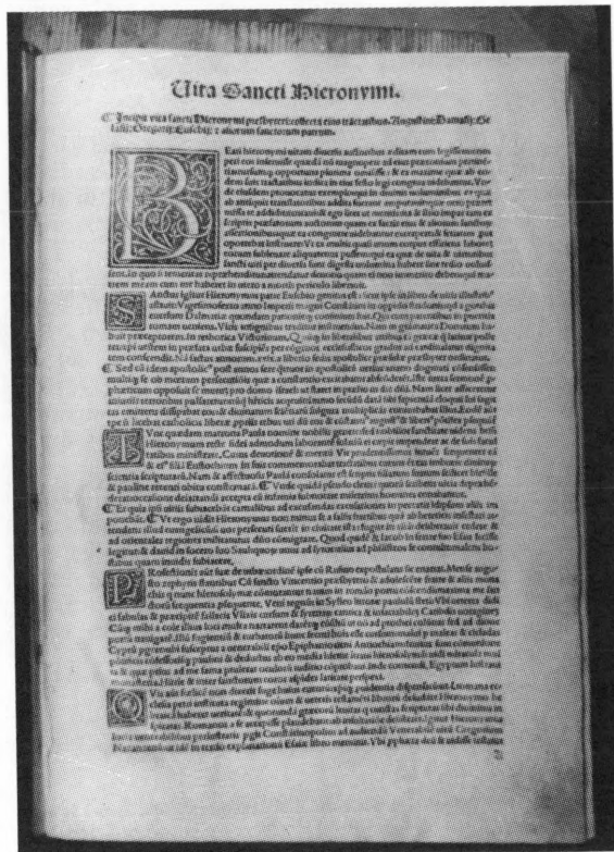
Tekst inkunabule "Biblijski komentari" počinje sa životopisom autora sv. Jeronima

Uz glazbenike, u franjevačkom samostanu sv. Antuna Padovanskog živjeli su i nadovnici slikari, kipari, obrtnici čija se djela i danas nalaze u samostanu i samostanskoj crkvi.