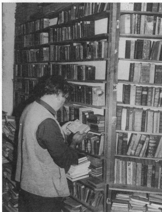
Fond knjižnice (oko 5000 svezaka) pretežno je klasificiran i katalogiziran

Glavno polje djelovanja koprivničkih franjevaca stoljećima je usmjereno prvenstveno na vjersku