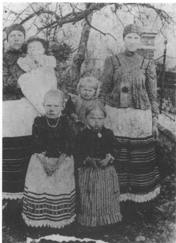
Žene i djeca iz Vukojevaca. Snimljeno 1916. godine. Na maloj pregači "kecelji" vidljiv motiv "penderki"