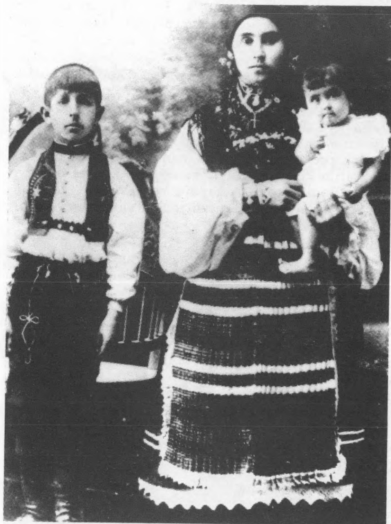
Žena iz Koške u "kecelji". Snimljeno 1916. godine

krajeva s prišivenim volanom. Šivana je strojem. Te su se pregače, prema kazivanjima, u srpskim selima Gazije i Gornja Motičina nosile već početkom ovog stoljeća. Sada više nema kazivača koji bi nam mogli reći kakve su se pregače nosile u tim selima prije ovih, ali svakako te pregače sadrže i neke starije elemente. Za sada ćemo napomenuti da su takve pregače nosile i Šokice iz Feričanaca. Pojava ove vrste pregače, izrađene od domaćeg usnivanog i pretkivanog tkanja, zahtijeva detaljnija terenska istraživanja, tim više, što je područje njezinog raspostranjenja sigurno veće. Za sada ćemo napomenuti da je pojavu pregače od crvenog ili crnog domaćeg usnivanog i pretkivanog tkanja (kariranog) zabilježila Zdenka Lechner u selima Golo Brdo i Vetovo u požeškom kraju, kao i u nekim selima pakračkog kraja. 9