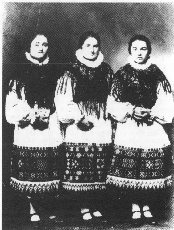
Djevojke iz Zoljana u svečanoj nošnji. Snimljeno 1937. godine. "Keclje" na fotografiji su "ubjerane tvtikom i vunicom". Na "kecljama" su vidljive "sam- lice"