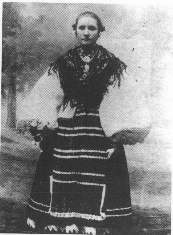
Djevojka iz Koške u svečanoj nošnji. Snimljeno 1916. godine