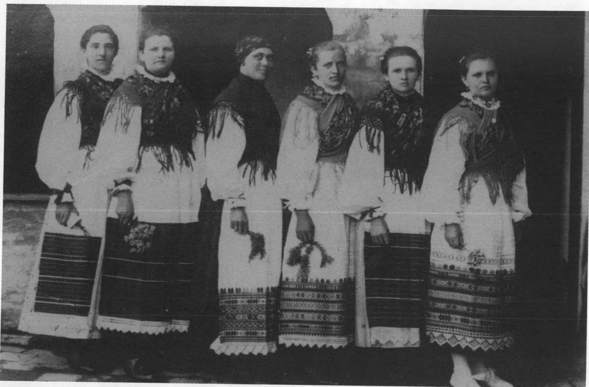
Našičanke u narodnoj nošnji, 1921.

od kojih spominjemo tek neke, zvane bezarice , batinjarkе , kašmirske .