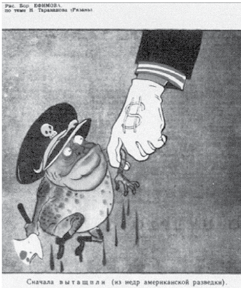
Prilog 5. „Iznova smo iščupali (iz utrobe američke obavještajne službe)”, izvor: Ivana Peruško Vindakijević, Od oktobra do otpora , Zagreb, 2018.