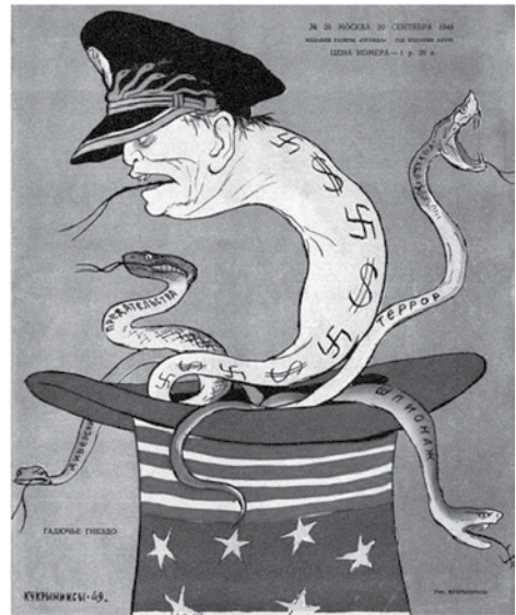
Prilog 6. „Zmijsko gnijezdo”, Krokodil , 1949.

kao dodvoravajuće „Yes” američkom dolaru pa je iz tog razloga većina političkih karikatura obilovala američkim simbolima. 52 Satiričnim se prikazom zapravo izražava kritika vanjske politike Jugoslavije koja je nakon sukoba sa Sovjetskim Savezom poboljšala odnose sa SAD-om. Tomu u prilog ide i činjenica nastanka samih karikatura (1949.-1952.) koja se podudara s početkom jugoslavenskog približavanja SAD-u.