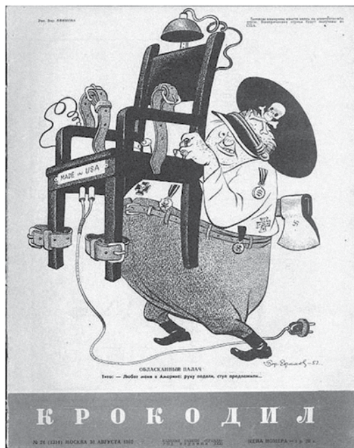
Prilog 8. „Pomilovan krvnik“, izvor: http://krokodilmagazine.blogspot.com/2012/