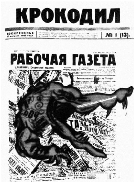
Prilog 1. Naslovnica Krokodila 1922. godine, izvor: https://krokodilmagazine.blogspot.com/2014/

o umjetničkoj nezavisnosti i radničkim praksama i o pravim dosezima Krokodilove popularnosti. 34