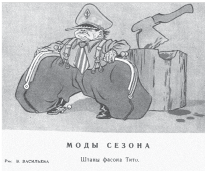
Prilog 7. „Modna sezona: hlače Titova kroja“, izvor: Ivana Peruško Vindakijević, Od oktobra do otpora , Zagreb, 2018.