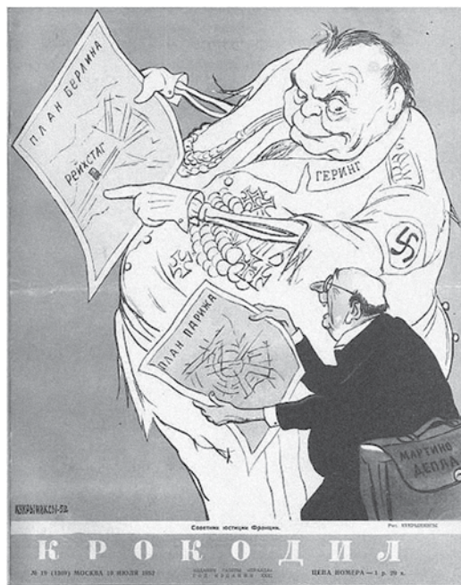
Prilog 9. Krokodil , 1952., izvor: http://krokodilmagazine.blogspot.com/2012/