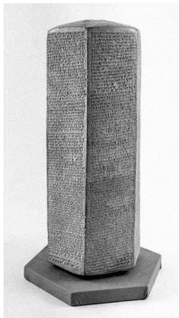
Slika br. 2. „Oriental Institute Prism”, Oriental Institute, Chicago (dostupno na: https://oi.uchicago.edu/collections/highlights/highlights-collection-assyria )

činjenica da se slažu u tome da je Egiptat na koncu iznevjerio svoje saveznike te da opisuju asirsku opsadu Jeruzalema. Poteškoće koje se javljaju prilikom kritičke analize izvora toliko su velike da se ne mogu tek tako pripisati različitim pogledima autora i različitim svrhama u koje su ti izvori pisani. 26 Senaheribovi anali govore o početku treće kampanje protiv Sirije kada su zauzeti Sidon i Aškelon, dok su drugi gradovi poput Arvada, Biblosa, Samsimuruna, Ašdoda, Amona, Moaba i Edoma razborito odlučili plaćati velik danak u zamjenu za prestanak ratnih razaranja. Za kralja Aškelona, Sidqu, koji se nije odlučio pokoriti, Senaherib je namijenio posebno okrutnu, ali nimalo neobičnu sudbinu za ono doba: „[B]ogove kuće njegovog oca, njega samoga, njegovu ženu, njegove sinove, njegove kćeri, njegovu braću, sjeme kuće njegovog oca, iščupao sam s korijenom i donio u Asiriju.” 27