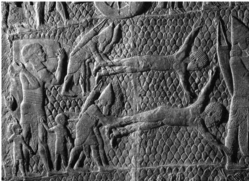
Slika br. 3 „Reljef iz Lakiša“

Pobunio se protiv asirskog kralja i nije mu više bio podložan.“ (2 Kr 18,7). Potvrđuje se da je Senaherib sa svojom moćnom vojskom zauzeo sve utvrđene gradove Judeje, a potom da je primio ogromnu količinu danka od kralja Ezekije. Asirski izvori navode osvajanje 46 teško utvrđenih gradova, nebrojeno mnoštvo manjih naselja i dobitak od 200150 zarobljenika. 31 Druga knjiga Kraljeva navodi identičnu količinu talenata zlata, ali znatno manju količinu talenata srebra.