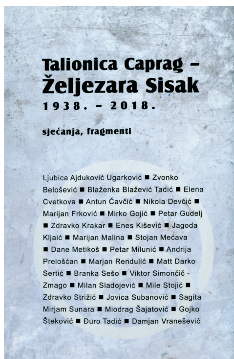
2019. Zbornik, urednik Đuro Tadić 2019 Proceedings, editor Đuro Tadić