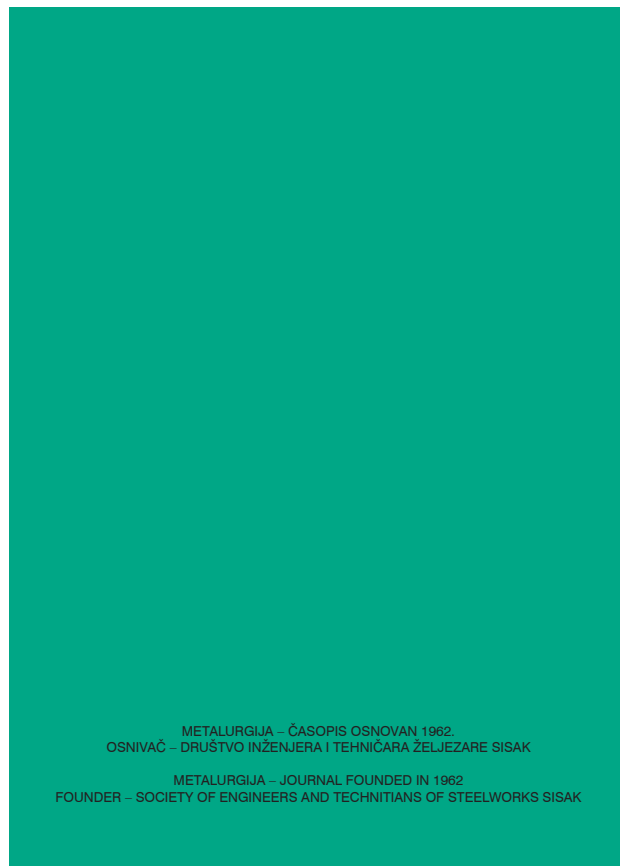
2020. Zadnja stranica korica: već 59. naveden osnivač 2020 Back cover: in '59 founder already listed