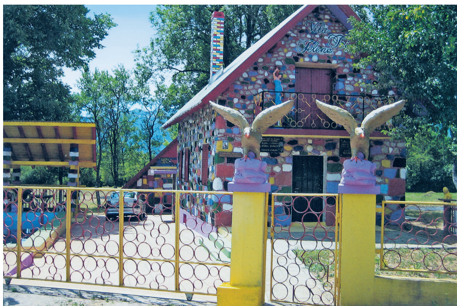
1978. Lika, planina Velebit, Vila Tri Jelene (djedovina od 1917. god.), ograda i kapelica sv. Barbari 1978 Lika, Velebit Mountain, Villa Tri Jelene (fatherland since 1917), the fence, and the chapel of St. Barbara