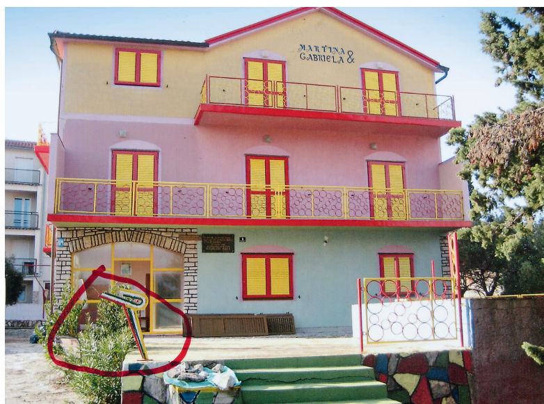
1974. Jadransko more, Murter, Vila Martina i Gabriela , Galebovo krilo i ograda 1974 Adriatic See, Murter, Villa Martina & Gabriela , Seagull's wing , and the fence