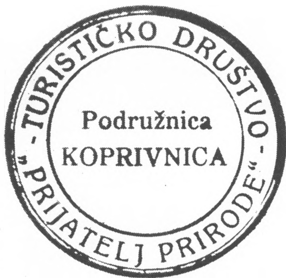
Otisak žiga podružnice »Prijatelj prirode« u upotrebi od 1928. do 1931. godine

Prva podružnica Turističkog društva »Prijatelj prirode« (u daljnjem tekstu PP) osnovana je kod nas 4. travnja 1905. godine u Sarajevu, i to kao podružnica (filijala) bečke centrale. Naime, u to vrijeme je Bosna i Hercegovina potpadala izravno pod vlast Austro-Ugarske monarhije. Osnivači i prvi aktivni članovi društva bili su većinom radnici na željeznici i to njemačkog porijekla, a o čemu svjedoče i njihova prezimena: Hoffman, Ajsenbajs, Baumgartner i druga. Međutim njima su se