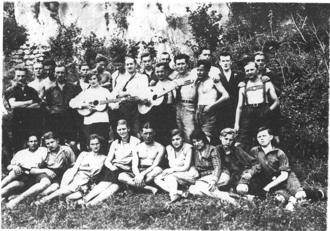
Društveni izlet članova PP iz Zagreba i Koprivnice na Kalnik 1930. godine