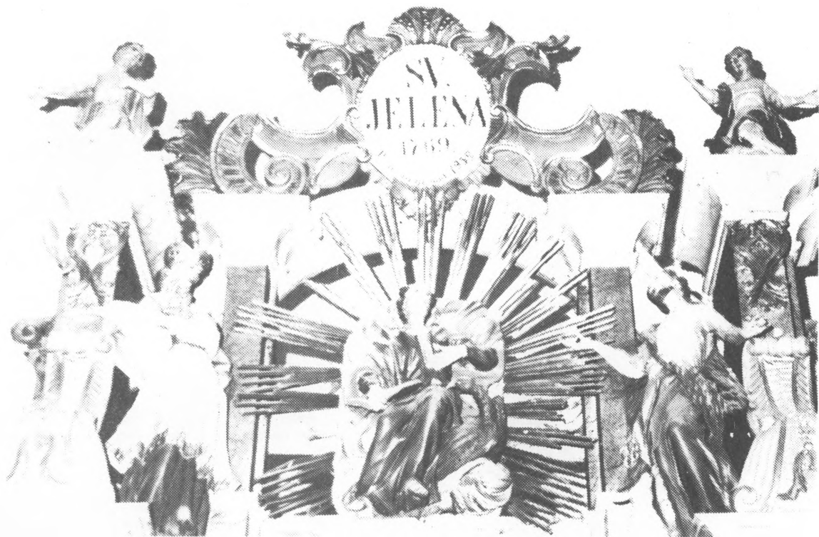
Atika glavnog oltara