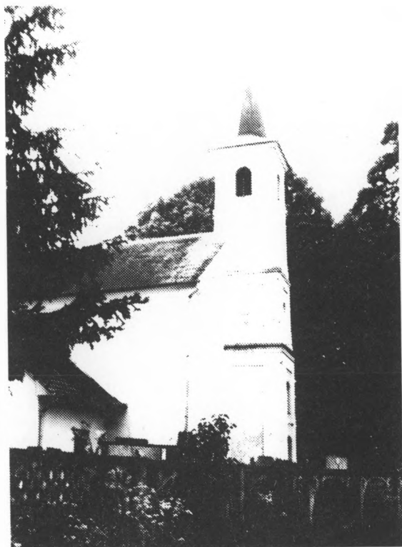
Pogled na kapelu Sv. Jelene sa sjeverne strane

Današnje selo dosta čudnog imena 2 nastalo je negdje oko godine 1700. Od 1710. već je u sastavu novoosnovane pitomačke župe (u čijem je sastavu i danas). 1714. u Otrovancu su već 22 kuće, a 1716. 28, dok iz izvora doznajemo poimence za 35 osoba, čija su se prezimena u znatnoj mjeri do danas zadržala. Godine 1733. u selu je 50 kućedomačina, 1771. 465, 1783. 447, a 1789. 353 stanovnika. Prema posljednjem popisu od 1981. Otrovance broji 707 stanovnika. Tokom cijelog svojeg postojanja selo se vrlo neznatno razvijalo, dok je najveći razvoj zabilježen od sredine XIX. pa do početka XX. stoljeća. 3