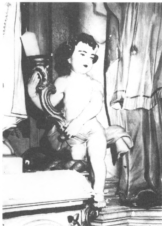
Desni kasnobarokni anđeo koji sjedi na tabernakulu

U nizu baroknih građevina u Podravini značajno mjesto zauzima i ova građevina i premda se ne radi o kapeli velike kulturno-povijesne vrijednosti, ali je ona ipak svjedok jednog nestalog vremena i stila.