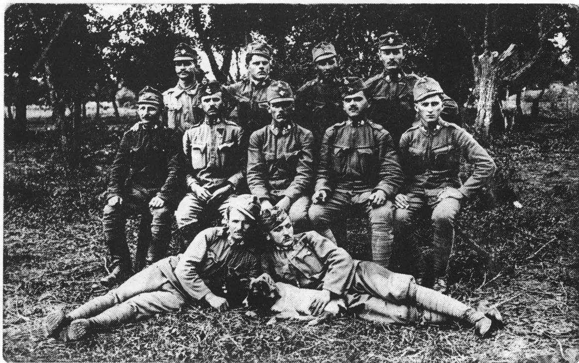
Ratnici Hrvati u Galiciji 1914. godine

U to vrijeme naše su obitelji imale brojnu djecu, a male, ili nikakve posjede. Zarada se mogla naći jedino na vlastelinstvu, a to su mogli samo mlađi, jači ljudi. Sad su ovi hranitelji otrgnuti od svojih porodica. Teški