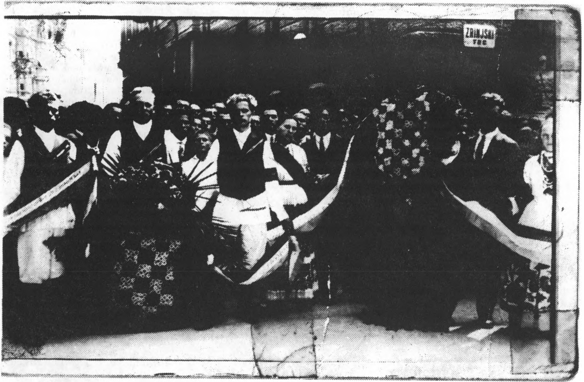
Ludbrežani na sprovodu Stjepana Radića

šen je vijenac njegovih štovatelja iz Ludbrega, gdje je on prvi put izabran 1908. godine.