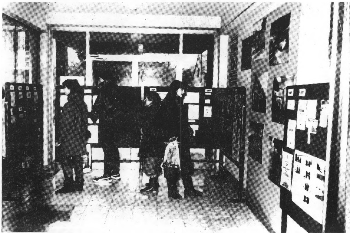
Izložba u prostorijama AMD-a povodom 40. obljetnice, otvorena 16.11.1987. godine.

16. studenog 1987. godine svečanom sjednicom Konferencije AMD-a koja je održana u Gradskoj vijećnici u Koprivnici obilježena je 40. obljetnica osnutka i rada