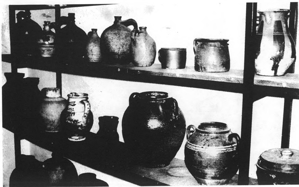
Muzejski postav grnčarije u MGK

Najveći je broj čupova različitih oblika i namjene. Oni imaju i svoje specifične nazive koji govore šta se u