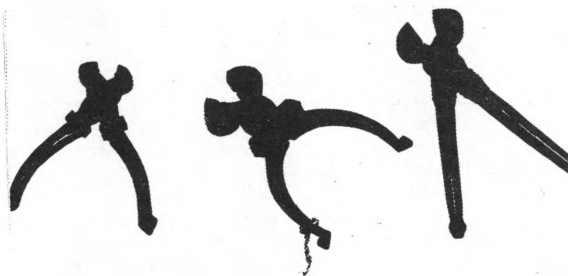
Klijesta za čupanje dlaka u muzejskoj postavi MGK

Jednu grupu čine predmeti koji su služili kao pomagala u preradi lana i konoplje te pribor za tkanje. Budući da se u ovom kraju tkalo do unazad dvadesetak godina, mnoga su pomagala još do danas sačuvana. Najbrojnije od svih su preslice . Sakupljeno ih je oko dvjestotinjak, a među njima se može naći veoma lijepih, vrijednih i starih primjera. Preslice su najčešće izrađivali momci i poklanjali ih djevojkama kao izraz svoje ljubavi, a izrađivali su ih i očevi i djedovi jer su se djevojčice veoma rano upoznavale s vještinom predenja. Primjerci preslica u muzeju skupljeni su u selima kopriwničke i đurđevačke općine, a najviše ih ima iz istočnih dijelova (Virje, Novigrad, Đurđevac). Od ostalih predmeta naročito se ističu svojom ljepotom oblika i ukrasa. Nakon dugogodišnjeg sakupljanja i proučavanja J. Fluksi je izdvojio dva osnovna tipa preslica koja bi bila zastupljena u najvećoj mjeri. Kopljasti tip koji je najbrojniji, raširen je na području istočno od Koprivnice, dok je lopatasti tip češći u krajevima zapadno i sjeverozapadno od Koprivnice. Javlja se i prijelazni kopljastolopatasti tip. Od ostalih tipova, zastupljenih u manjoj mjeri, javlja se još križna preslica, češća u zapadnijim dijelovima, viličasta i zubasta.