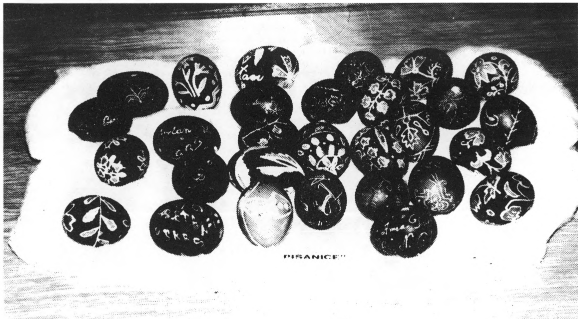
Pisanice u muzejskoj postavi MGK

spadaju štakornice i mišolovke koje sam već spomenu- la kod obrade drvenarije. Štakornice su izrađene u obliku drvene kutije s pokretnim poklopcem i zasunom koji se pokreće pomicanjem mamca. Mišolovka je drvena s metalnom oprugom i omčom. U cijelosti izrađene od metala su zamke . Dva su tipa zamki. Prva zvana železo je metalna, velika, za lisice i vukove. Izrađivali su ih kovači ili vještiji seljaci. Te su četvrtastog oblika, a sastoje se od pokretnih hvataljki sa zupcima koje zateže čelična opruga. Manje zamke su služile za lov manjih životinja i ptica. Okruglog su oblika i s hvataljkama bez zubaca. 10