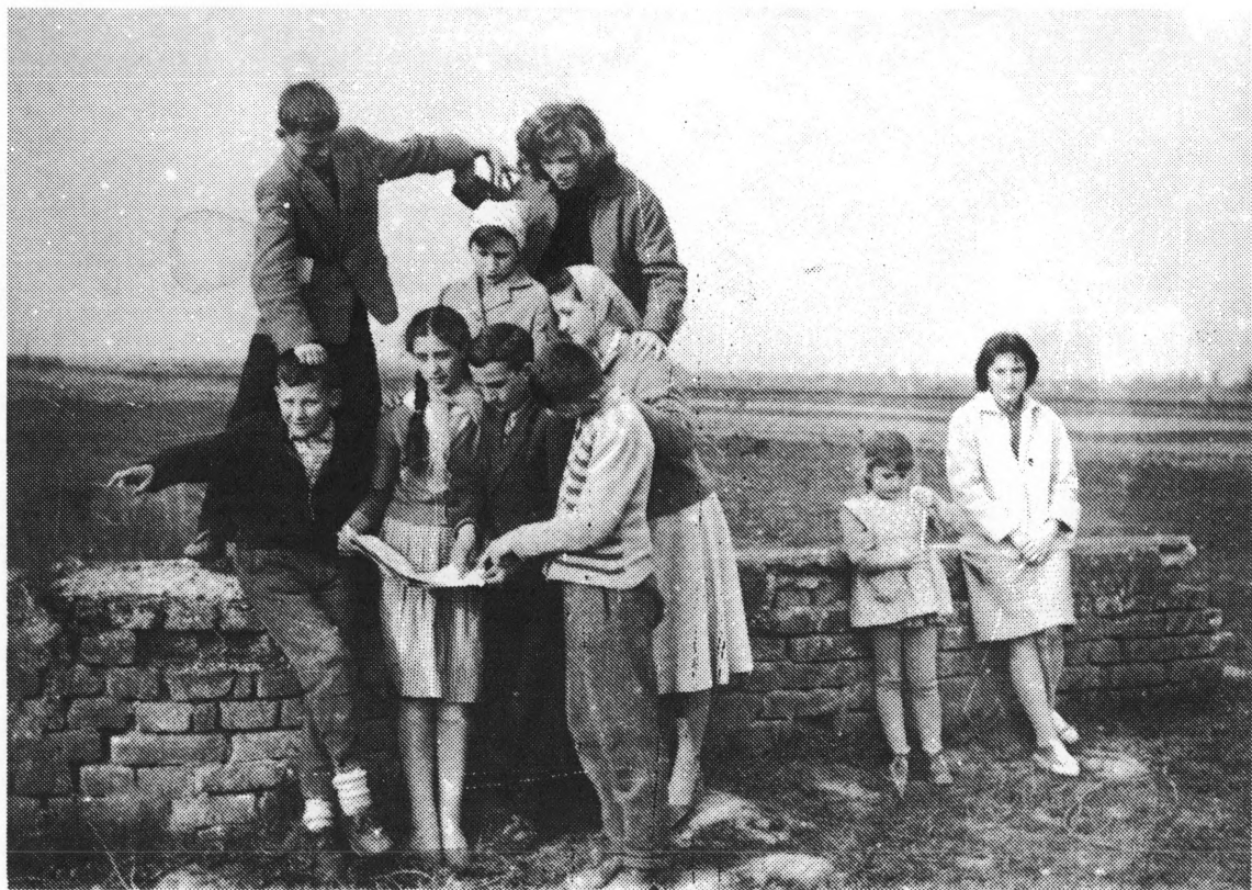
Scenarijska ekipa Pionirske filmske grupe na terenu za snimanja igranog filma »Crna mačka« 1960.

snima se!« iz Beograda i »TRI NAŠE PRIČE« iz PITO-MAČE. Emitiranje je izvršeno 3. lipnja 1961. a u studiju RTV Beograd su sudjelovale Nada Čerepinko i Biserka Kolarević, i to uživo, jer još nije bilo magnetoskopa.