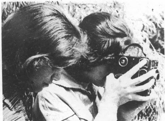
Dvije djevojčice na snimanju (s kamerom Nada Čerepinko, asostira Biserka Kolarević) 1961

godine, iako od inventara posjeduje samo jednu kino-kameru od 16 mm, kojom su snimljene 3 filmske reportaže 7 . Kad je već riječ o kinoamaterskom radu, treba svakako istaći da je uprava Kluba već prije 2 godine uvidjela da sa starijim članovima u tom pogledu neće biti mnogo uspjeha, već da se treba što više orijentirati