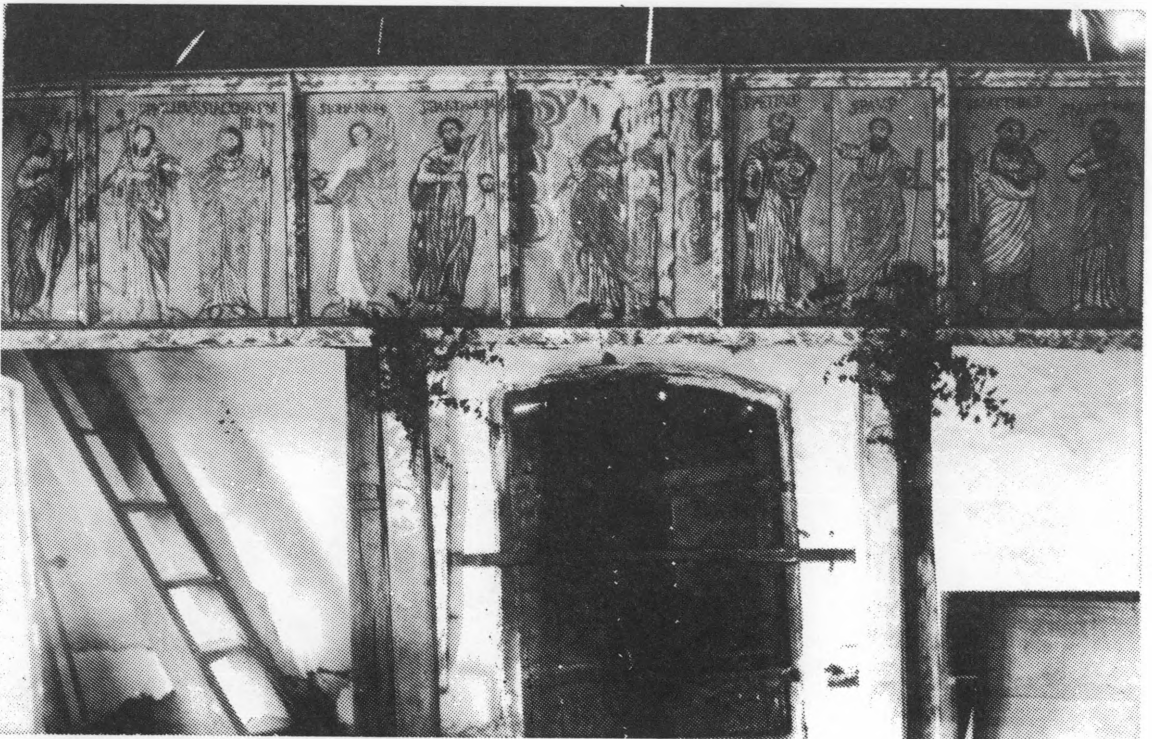
Glavna (zapadna) ulazna vrata kapele Svetog križa sa oslikanom ogradom kora 1916.

Autor, ili autori, ovih oltara ostali su nepoznati.