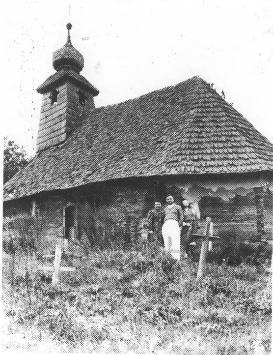
Kapela Svetog križa nakon demontiranja tabulata snimljena 1950-ih godina

Zbog poroznosti materijala od kojeg je bila izgrađena već 1780-ih godina kapela je bila u dosta lošem stanju. Međutim, tek početkom ovog stoljeća se ozbiljnije pokušalo prići popravljaju kapele i njezinom eventualnom demontiranju, te izgradnji nove kapele. Nakon nekoliko desetljeća kapela je bila zaista u toliko lošem stanju da se očekivalo njezino rušenje, a time i uništenje svega onog što se u njoj nalazilo, pa se u prosincu 1939. moralo prići, u suradnji sa Etnografskim muzejom i Muzejom za umjetnost i obrt u Zagrebu, prisilnom demontiranju svega vrijednog iz njezine unutrašnjosti. Gotovo sav inventar je preseljen u rečene muzeje u Zagreb, dok je jedan dio bio čuvan u župnom uredu u Turnašici među kojem i spomenute orgulje. Nakon II. svjetskog rata njezin se inventar u velikoj mjeri zagubio, tako da je danas ostalo od njega vrlo malo, i premda je bilo mnogih pokušaja da se on sakupi. Neki dijelovi tabulata, pokoji stup, nekoliko skulptura, te or-