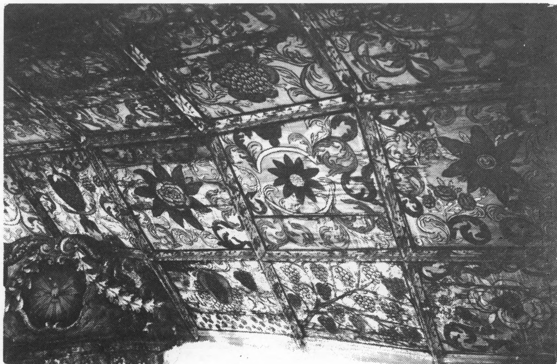
Snimak tabulata južne strane kapele Svetog križa 1916.

Čijeli strop ove kapele, kako je spomenuto, bio je presvučen askama na kojima je bilo islikano mnoštvo ornamentiranih slika, sa dosta prizvuka baroka, uglavnom raznim motivima iz svijeta flore. Umjetnički je bila