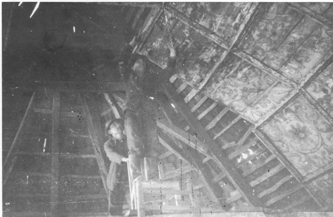
Demontiranje tabulata u prosincu 1939.

Najljepši od oltara bio je glavni oltar, koji je bio nakićen ukrasima. On je bio ujedno i najveći. Najimpozantnija od skulptura svakako je bilo raspeće, koje je, čini se, moglo biti nešto starije i vjerojatno potjecalo iz onog oltara što ga 1733. spominje Bistrički. Ono je gotovo ugurano u sredinu oltara i izlazi iz konteksta cijele njegove forme.