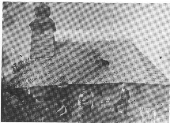
Kapela Svetog križa snimljena s južne strane 10. VII. 1933.

dine naselja na jednom povećem brijegu, u srednjem vijeku se nalazilo naselje sa posjedom i gradinom zvano Farkaševac (»Farkasewcz«). Postojalo je sve do prolaza turske vojske sredinom XVI. stoljeća. 4