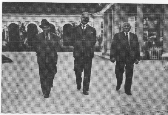
1. Braća Scheyer na službenom putu

cehovi ne primaju obrtnike – Židove u svoja udruženje. Tom narodu nije preostalo ništa drugo već jedino trgovina, a s njom je povezan i novčani kapital. Baveći se kroz stoljeća takvim poslovima, mnogi su se silno obogatili. To su mogli tim lakše što je većina kršćana uzimanje kamata na zajam, ili profit u trgovini, smatrala nepoštenim i griješnim poslom. Prepuštali su to prezrenim Židovima, a ovi su u tome bili vrlo vješti: prihvatili su svaku priliku i zadovoljili se i najmanjim dobitkom. Poslovi su prelazili od oca na sina, a time je rasla i glavica što je većinom drže u tajnosti, i to s pravom. Njihovi kršćanski susjedi često su se vrlo nekršćanski ponijeli spram njih: razgrabili bi im mukom stečenu imovinu i nerijetko bi ih i zlostavljali.