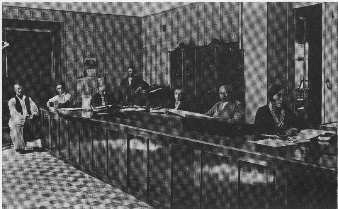
2. Unutrašnjost ludbreške štedionice

Židovi su bili većinom trijezni, štedljivi ljudi, radini i snalažljivi. Njihov se imetak stalno povećavao. U njihovim se rukama našao velik kapital, te su često bili vjeronici i okrunjenim glavama. Američki Židovi austrijskog porijekla spasili su austrijskog cara Franju Josipa i njegovu državu od konačne propasti, tj. svojim su novcem tu propast na kratko vrijeme odgodili. Za tu uslugu u cijeloj Habsburškoj monarhiji Židovi su pred zakonom izjednačeni i s ostalim državljanima. Kao imućni građani ubrzo su izbili u vrh vladajuće klase. Od propalih plemića oni kupuju stare dvorce s ostatkom feudalnih posjeda da bi ih za kratko vrijeme rasprodali uz znatnu dobit. Uzimali su u zakup rudnike i šume, podizali tvornice, gradili čitave blokove kuća u gradovima. Uglavnom, oni su glavni bankari, industrijalci, ren-